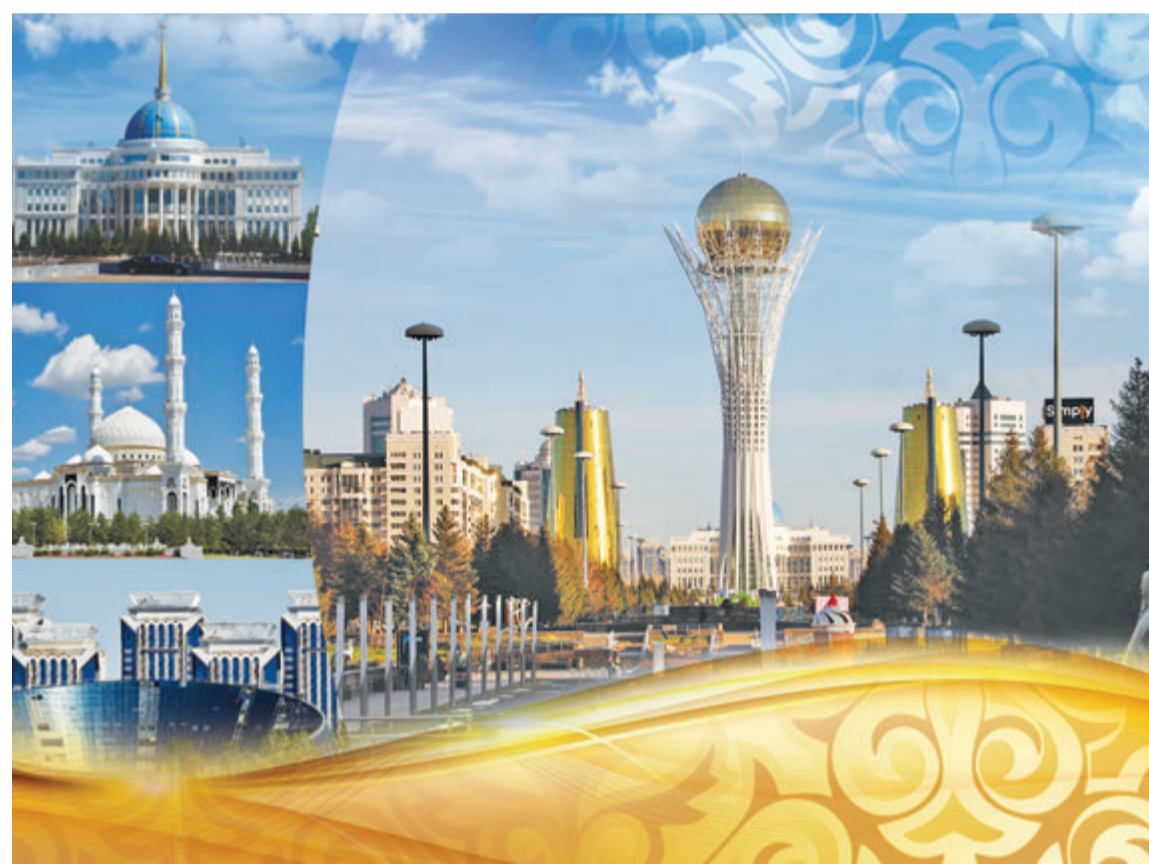
Коллаж Юрия БИЛУШЕНКО. Фото Александра МАРЧЕНКО

Астана заняла свое достойное место на международной арене