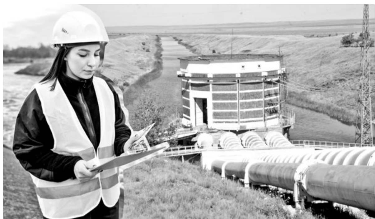
Коллаж Натальи РОМАНОВСКОЙ, фото из архива «ИК» и magnific.com

Не забывают и о цифровизации. С начала года Министерством водных ресурсов и ирригации внедрена автоматизированная система «Биллинг», позволяющая упростить процедуру заключения типовых договоров на оказание