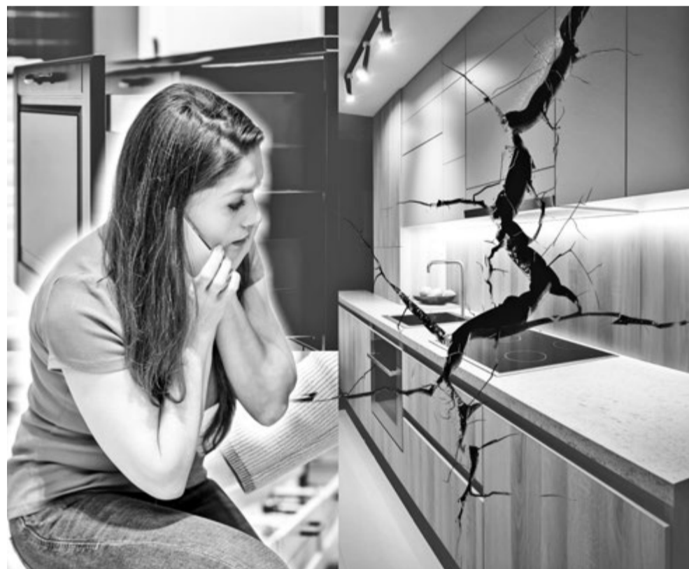
Коллаж Натальи РОМАНОВСКОЙ, фото magnific.com

Не добившись результата самостоятельно, она решила обратиться в департамент торговли и защиты прав потребителей по Карагандинской области. Специалисты