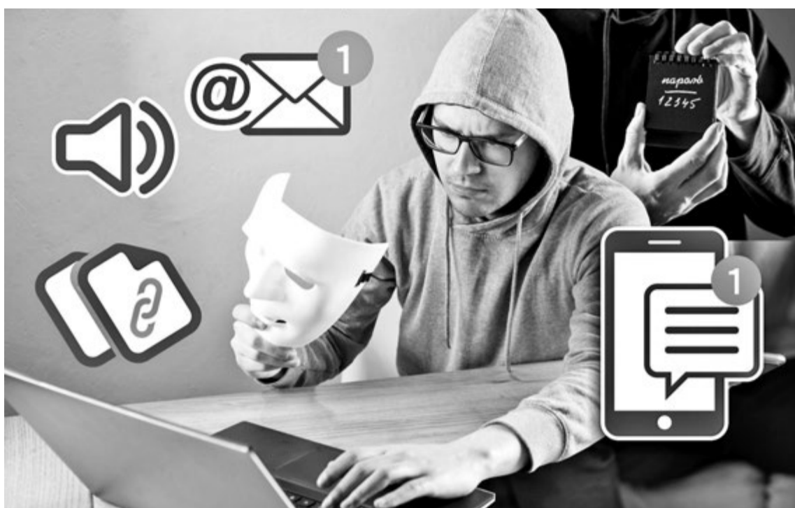
Коллаж Натальи РОМАНОВСКОЙ, фото magnific.com

Особую опасность представляют телефонные звонки, сообщения в мессенджерах, электронные письма и ссылки на сомнительные сайты. Следует