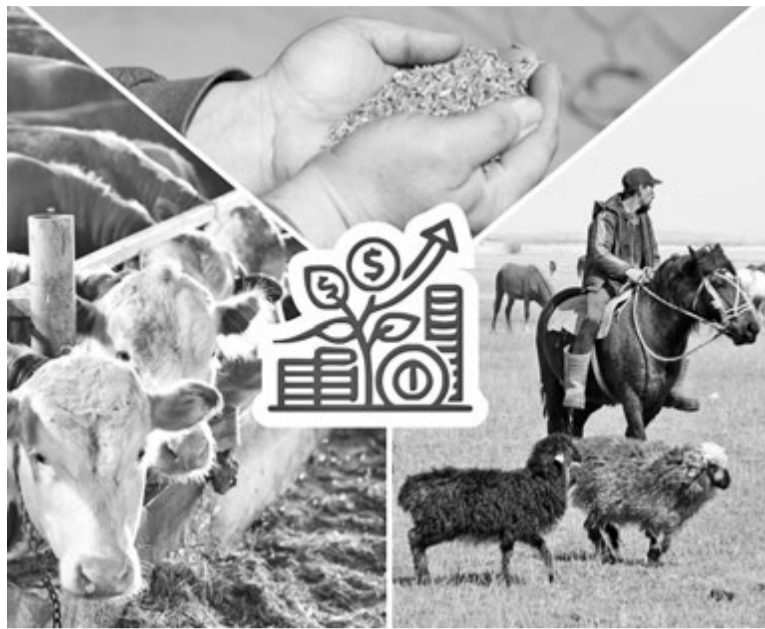
Коллаж Натальи РОМАНОВСКОЙ, фото Александра МАРЧЕНКО

В 2026 году прием заявок стартовал беспрецедентно рано – в октябре 2025 года. Всего в текущем году на льготное финансирование весенне-полевых и убо-