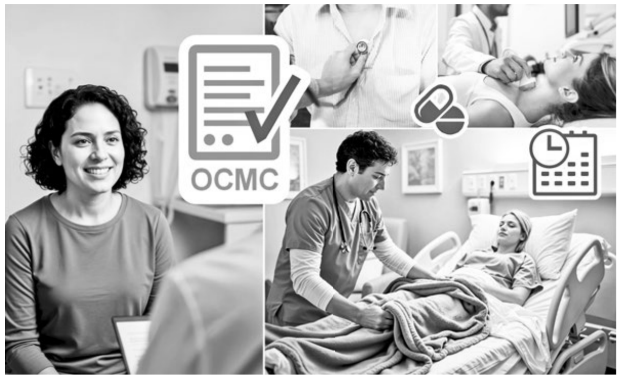
Коллаж Натальи РОМАНОВСКОЙ, фото magnific.com

Наиболее часто выявляются нарушения, связанные с несоблюдением стандартов диагностики и лечения, а также случаи завышения стоимости оказанных медицинских услуг.