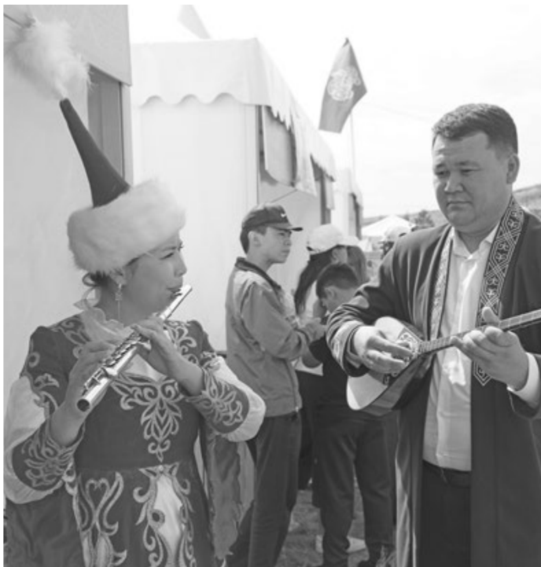
гг. Каркаралинск – Караганда

К слову, из-за большого наплыва желающих специально было увеличено число бесплатных автобусов из Караганды – с четырех до шести. С этого года BaiQumyz включен в республиканский календарь культурно-туристических мероприятий и будет проходить ежегодно.