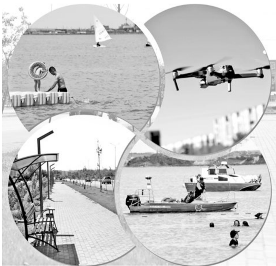
Коллаж Натальи РОМАНОВСКОЙ, фото Александра МАРЧЕНКО

В этом году ожидается прибытие порядка 600 тысяч отдыхающих, в том числе около 40 тысяч иностранных гостей. Чтобы еще увеличить поток, создаются условия, при которых турист получит