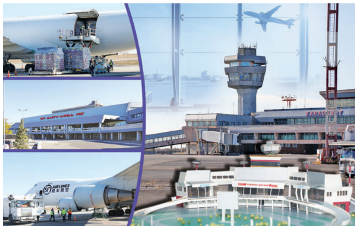
Коллекция: Юрия БИЛУШЕНКО, фото Александра МАРИЧЕНКО и freepik.com

Караганда в сочетании с расширяющимся потенциалом портов на Каспии становится важным звеном в международной логи-