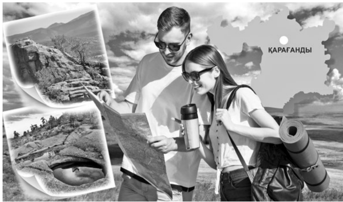
Коллаж Юрия ВЛЮШЕНКО, фото freerick.com и из архива «ИК»

В рамках цифровой трансформации деятельность центра направлена на повышение доступности информации и удобства для туристов. Внедряются современные цифровые решения, включая чат-ассистент, туристский портал, а также элементы навигации и информирования на ключевых маршрутах. В настоящее время основной задачей является пере-