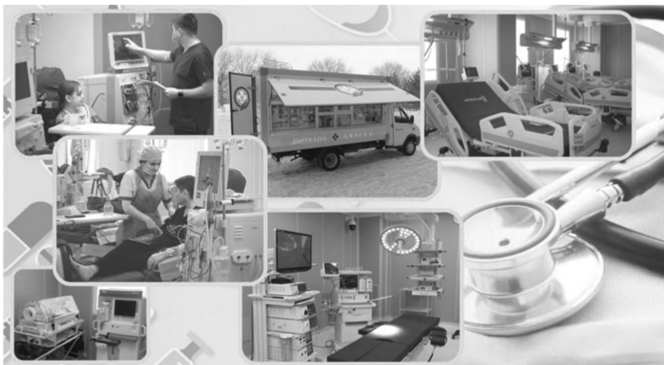
Коллаж Юрия Вилушенко, фото Александра Марченко и freepik.com

Когда речь заходит о медицине, людей обычно волнует простое и понятное: можно ли попасть к врачу, пройти обследование и сколько за это придется заплатить. Для жителей Карагандинской области эти вопросы особенно чувствительны. Регион большой, с крупными промышленными городами, отдаленными районами и высокой нагрузкой на систему здравоохранения. Поэтому доступность медицинской помощи здесь имеет особое значение.