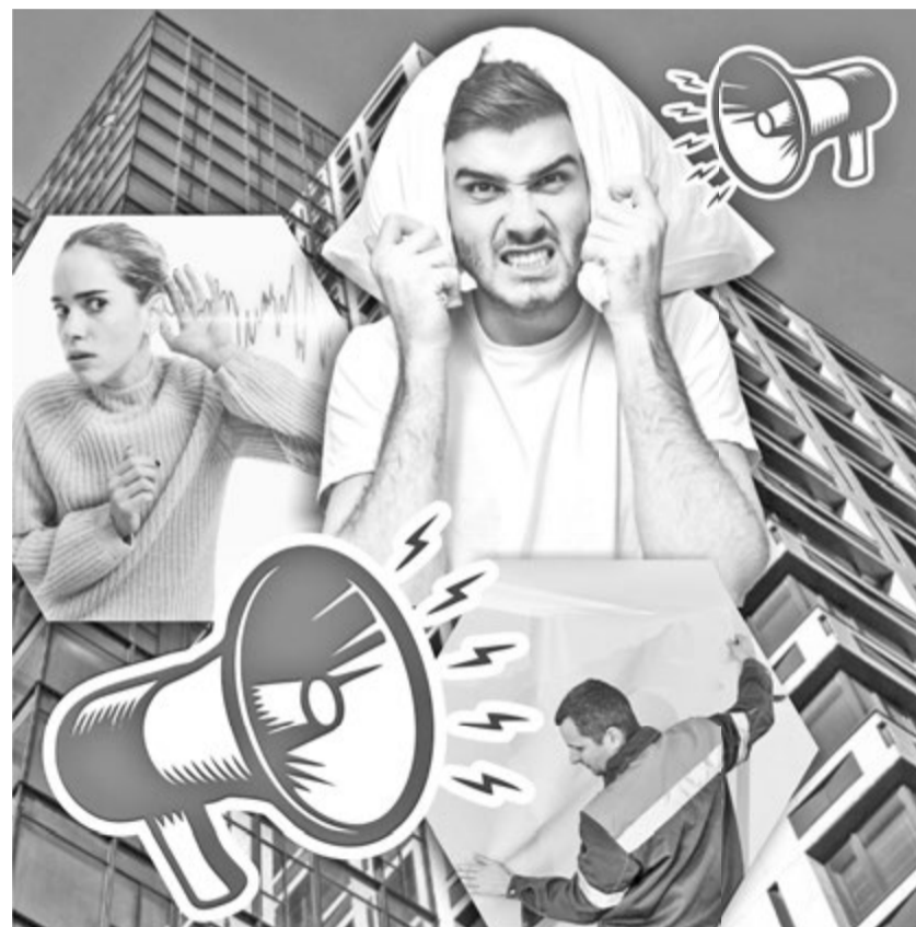
Коллаж Натальи РОМАНОВСКОЙ, фото freepik.com

Затем Е. Байрамов обратился в областной департамент торговли и защиты прав потребителей. После рассмотрения обращения и проведения необходимой работы выявленные нарушения были устранены застройщиком. Иными словами,