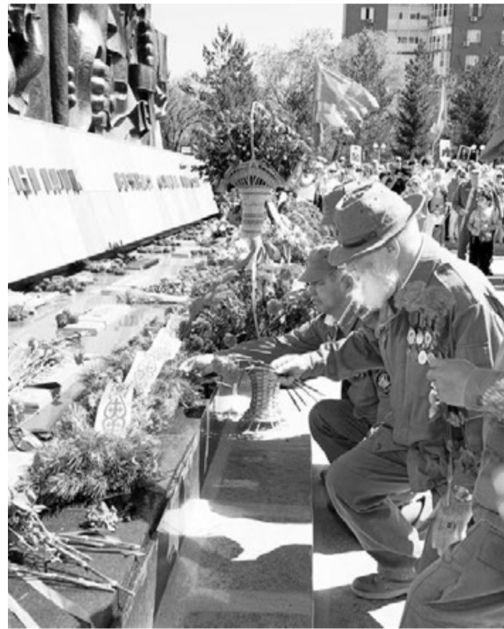
г. Балхаш