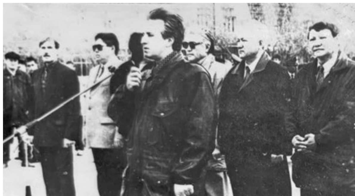
В продолжение празднования Дня Победы состоялась 53-я легкоатлетическая эстафета на призы газеты «Индустриальная Караганда». 1998 г.