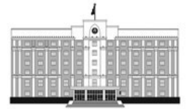
АКИМАТ КАРАГАНДИНСКОЙ ОБЛАСТИ

подтвердил заинтересованность в сотрудничестве. По его словам, помимо туризма, в регио-