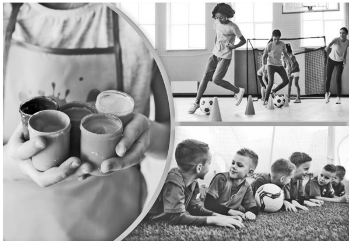
Коллаж Натальи РОМАНОВСКОЙ, фото freepik.com

Сейчас проводится реформа мер государственной поддержки