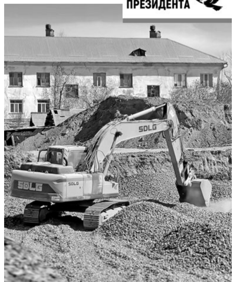
Фото акима г. Приозерска

Особое внимание уделяется не только количеству мест, но и качеству образовательной среды.