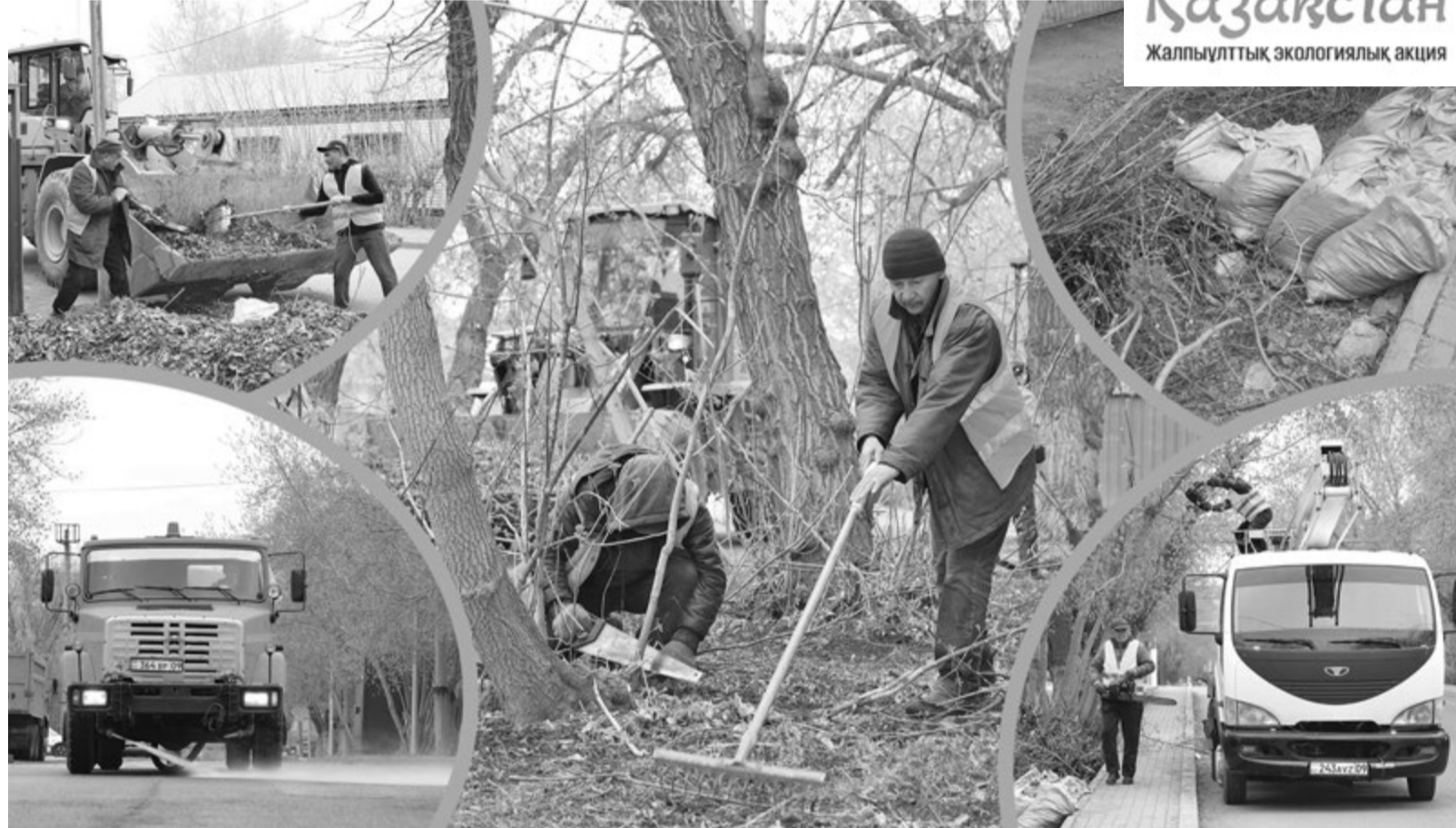
Коллаж Юрия БИЛУШЕНКО

– Принято решение комплексно подойти к уборке улиц, в которой участвуют четыре подрядные организации. Первым делом проводим подрезку аварийных и сухих веток на деревьях. Предприятие, выигравшее тендер по освещению, устраняет возможные неполадки. Затем вступает в работу фирма, ответственная за уборку тротуаров. После того как подрядчики завершают все этапы, на участок заходит основная компания, занимающаяся содержанием городских дорог, и окончательно