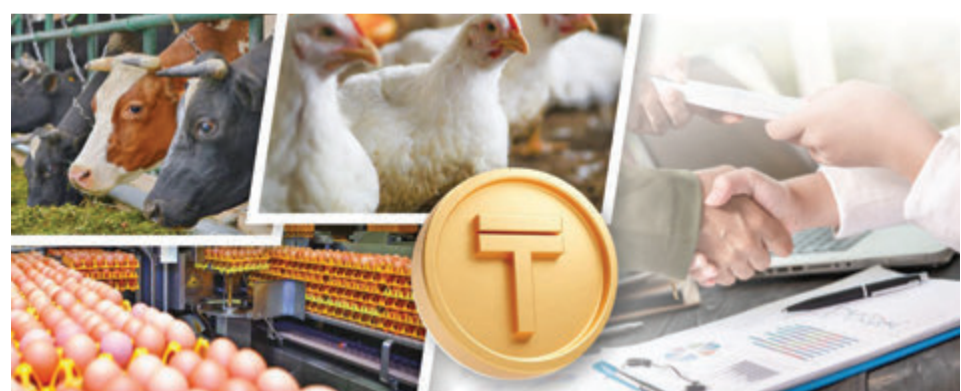
Коллаж Юрия БИЛУШЕНКО, фото freepik.com

Государство начало финансирование фермеров в рамках масштабной программы поддержки отечественного животноводства.