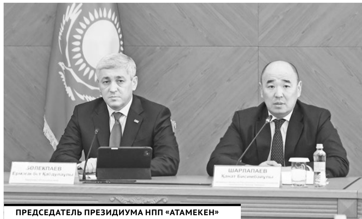
ПРЕДСЕДАТЕЛЬ ПРЕЗИДИУМА НПП «АТАМЕКЕН» КАНАТ ШАРЛАПАЕВ ПОДЧЕРКНУЛ, ЧТО КАРАГАНДИНСКАЯ ОБЛАСТЬ – МОЩНЫЙ ИНДУСТРИАЛЬНЫЙ ХАБ С ОГРОМНЫМ ПОТЕНЦИАЛОМ.

Посетил председатель президиума НПП «Атамекен» и IT-hub «Терриконовая долина». С момента его основания в 2021 году запущено 600 стартап-проектов, привлечено более 100 миллионов тенге инвестиций. Здесь прове-