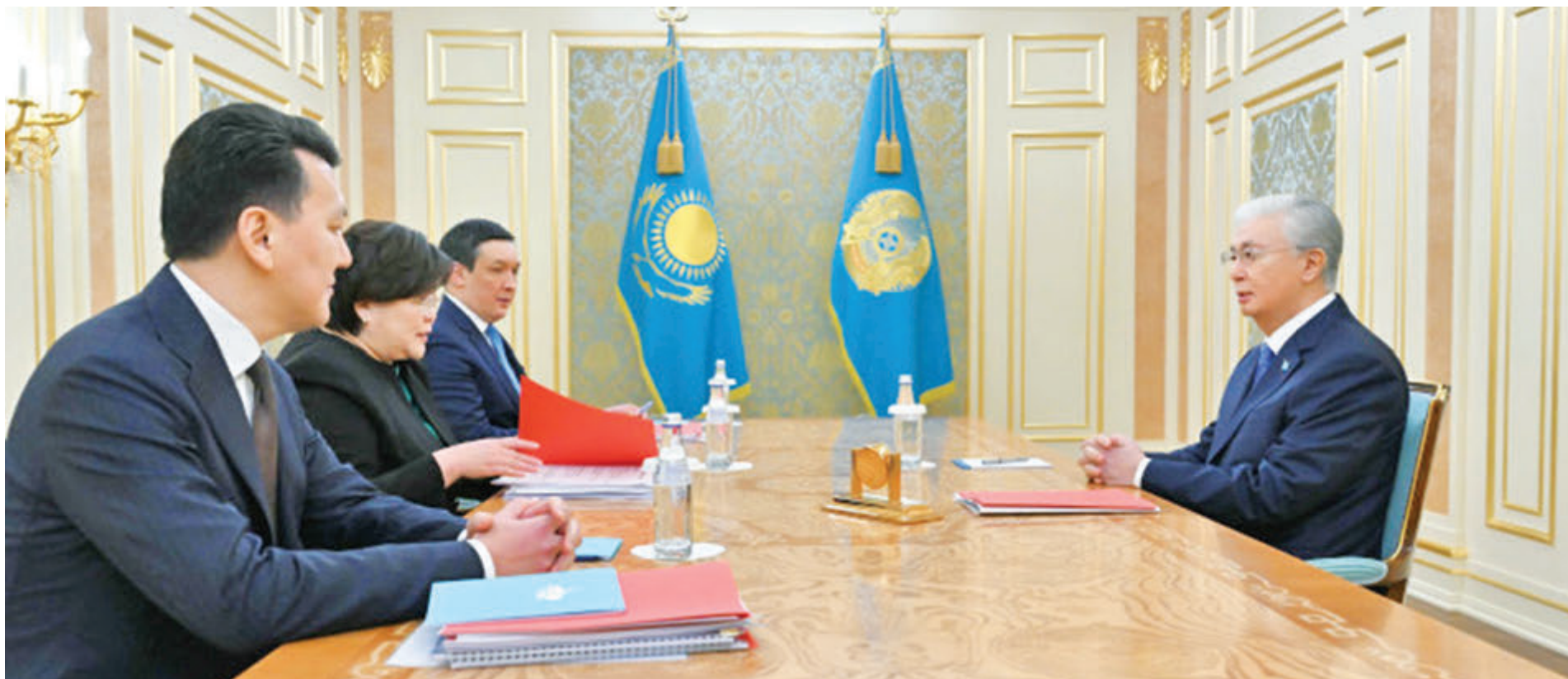
Конституционная комиссия представила Главе государства итоговый проект новой Конституции.

Президент Республики Казахстан К.ТОКАЕВ Астана, Акорда, 11 февраля 2026 года № 1170