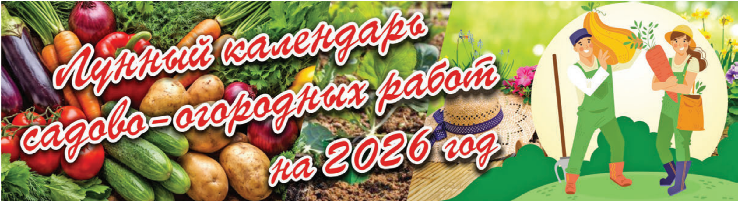
Коллаж Натальи Романовской, иллюстрация ChatGPT и freepik.com

Каждый огородник знает: успех урожая зависит не только от труда, но и от времени. Ночное светило помогает растениям лучше приживаться после пересадки и отдает силы корням в нужный момент. Понимание фаз Луны подсказывает, когда сеять семена, вносить удобрения или собирать плоды. Если следовать этим природным ритмам, плоды сада и огорода вырастут крепкими, а работа становится легче и приятнее.