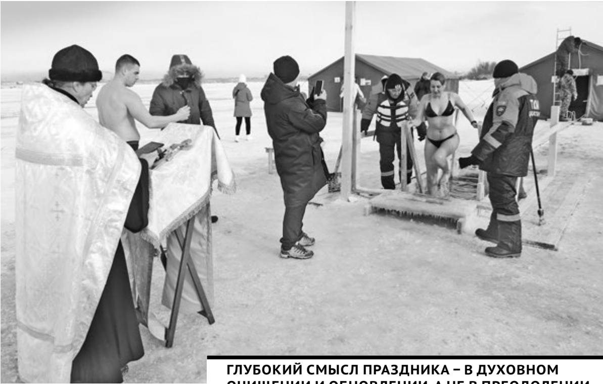
ГЛУБОКИЙ СМЫСЛ ПРАЗДНИКА – В ДУХОВНОМ ОЧИЩЕНИИ И ОБНОВЛЕНИИ, А НЕ В ПРЕОДОЛЕНИИ ХОЛОДА.

– Честно говоря, меня на это подтолкнул ее пример. Я и так ежедневно обливаюсь, но здесь