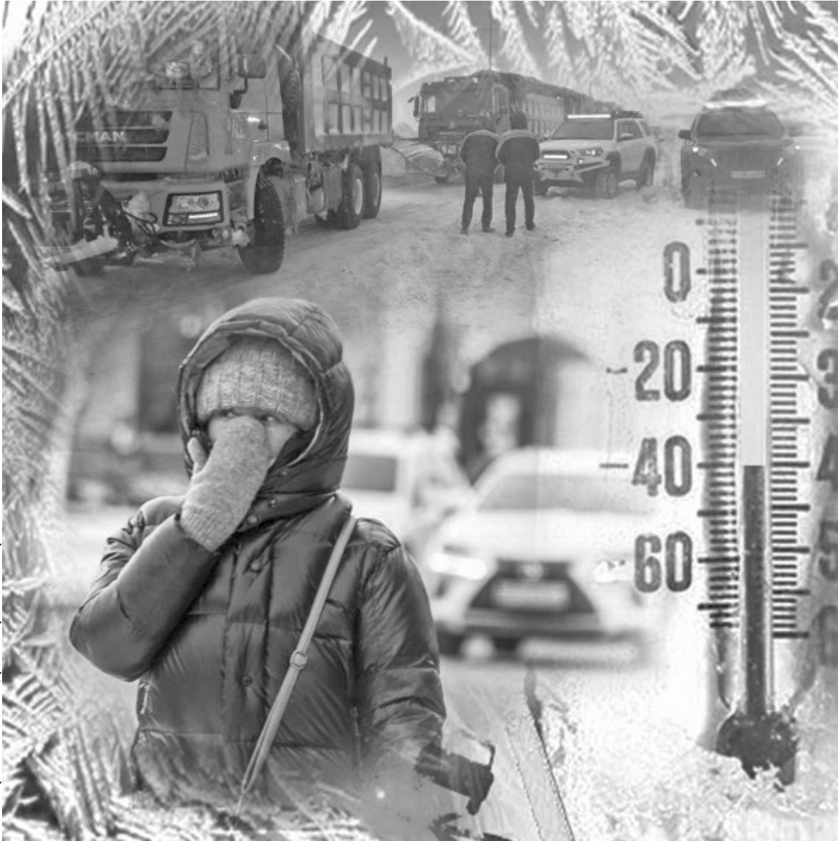
Коллаж Юрия БИЛУШЕНКО.

Пользоваться необходимо только исправными газовыми и