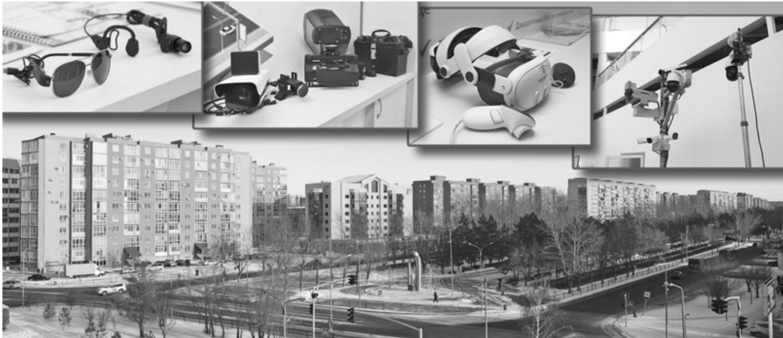
Коллаж Юрия БИЛУШЕНКО

В регионе реализуются цифровые проекты в сфере общественной безопасности, транспорта, городской инфраструктуры и управления данными, большинство из которых уже работает в реальном режиме.