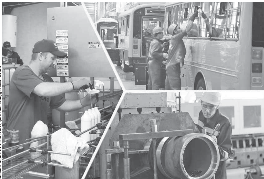
Коллаж Юрия БИЛУШЕНКО. Фото Александра МАРЧЕНКО

По данным пресс-службы РПП «Атамекен», обладателем номинации «Лучшие товары для населения» стала компания по производству биоразлагаемой бытовой химии ТОО «WEC Trade». Как отметил директор Вячеслав Цой, это доказательство