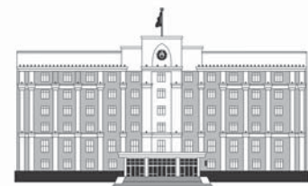
АКИМАТ КАРАГАНДИНСКОЙ ОБЛАСТИ

– Прошло более 30 лет, как в наших домах отключили центральное отопление, – рассказывала она. – Чего только мы не пережили за это время! Многие, в том числе и мы с мужем, поставили печки в квартирах. Сейчас живу одна, и мне очень