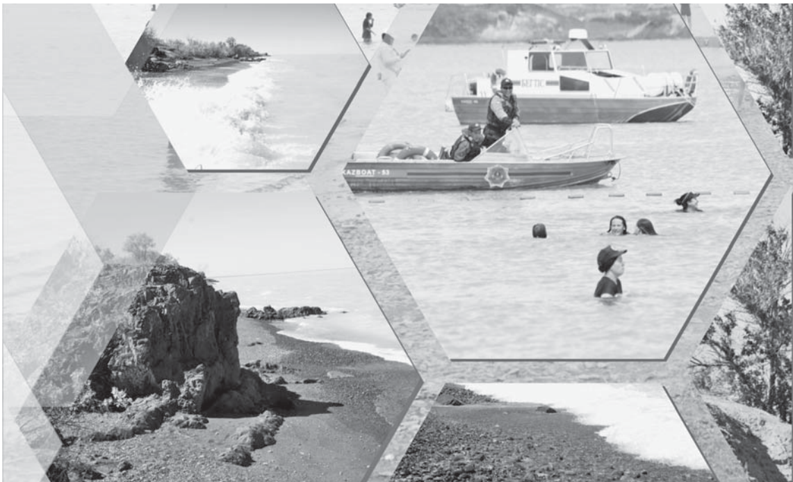
Коллаж Натальи Романовской, фото Александра Марченко

Балхаш – город промышленный, но здесь взяли курс и на развитие бизнеса. Как сообщил на брифинге Региональной службы коммуникаций аким Балхаша Сапар Сатаев, сейчас здесь работает около шести тысяч субъектов предпринимательства. За 2024 год они оказали услуг на 80 млрд тенге. В этой сфере трудятся более 11 тысяч человек – это почти треть активного населения. В сферу торговли и услуг было привлечено 2,5 млрд тенге инвестиций, реализовано 15 новых проектов и создано 99 рабочих мест.