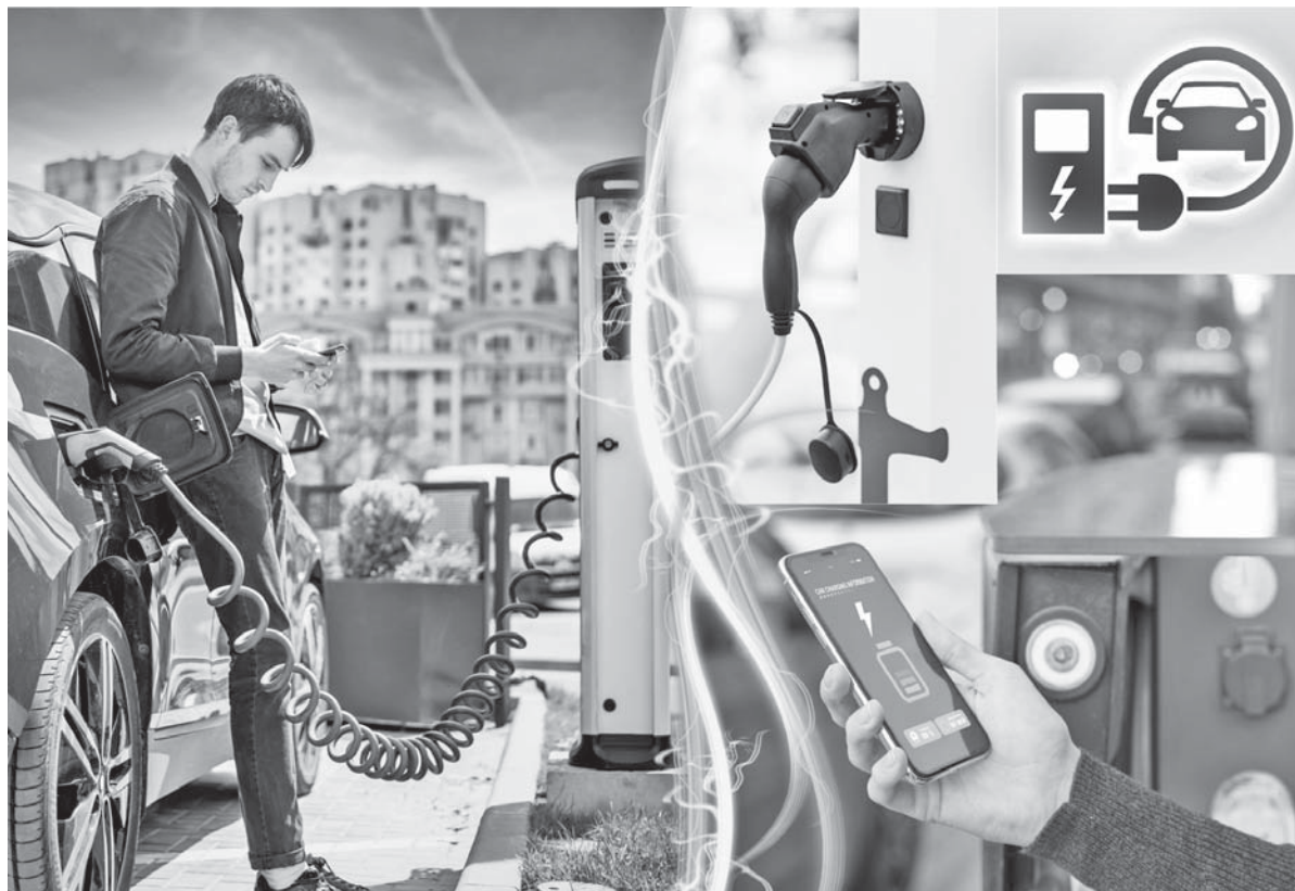
Коллаж Натальи Романовской, фото freepik.com

– Например, у супруги – кроссовер с электрическим линейным разгоном, после которого на бензиновую машину уже никогда не захочется возвращаться, клиренсом 20 см, неубиваемой надежностью. Электромобили практически вообще не ломаются, им требуются лишь стандартное обслуживание ходовой части, замена масла в редукторе и фильтра в салоне. В самом Китае на большинство таких авто – пожизненная гарантия на всю электрическую часть, а на батарее моих электромобилей производитель вообще обещает 1 200 000-1 500 000 км до снижения емкости до 80%. Подкупает и более дешевой эксплуатация, ведь ездить на электричестве значительно дешевле. При этом не надо менять масло в моторе, свечи, ремни, помпу и прочее. В электромобиле значительно меньше деталей, поэтому он намного проще бензиновой машины. И все-таки, сделав изначально выбор ради значительной экономии при эксплуата-