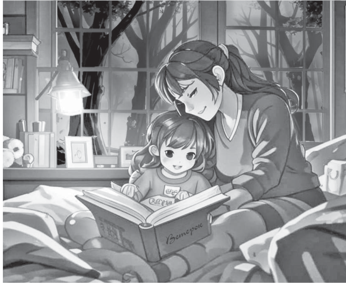
Коллаж Натальи Романовской

И вот однажды он решил посмотреть, что находится внизу.