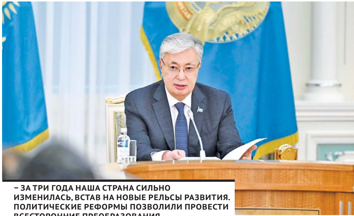
– ЗА ТРИ ГОДА НАША СТРАНА СИЛЬНО ИЗМЕНИЛАСЬ, ВСТАВ НА НОВЫЕ РЕЛЬСЫ РАЗВИТИЯ. ПОЛИТИЧЕСКИЕ РЕФОРМЫ ПОЗВОЛИЛИ ПРОВЕСТИ ВСЕСТОРОННИЕ ПРЕОБРАЗОВАНИЯ.

Примечательно, что столь важное и масштабное событие проходило в преддверии светлого праздника Наурыз, который в этом году совпал со священным месяцем Рамазан. Его значимость Глава государства подчеркнул, поздравив наших соотечественников с Аман күні – днем, когда мы встречаемся с самыми родными и близкими людьми после долгой зимы.