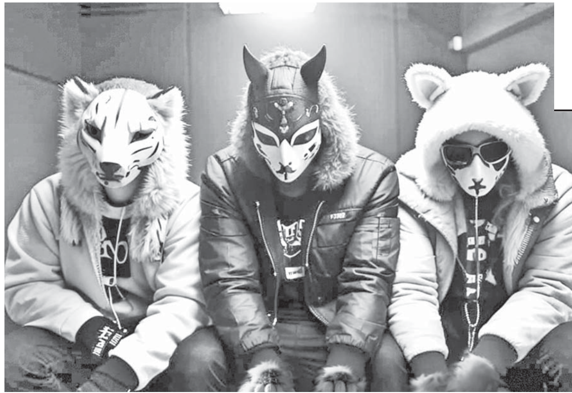
Коллаж Натальи Романовской

Алексей рассказал, что быстро нашел таких же энтузиастов