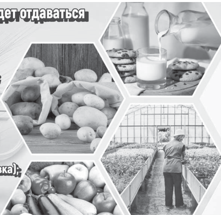
Коллаж Юрия Вилушенко