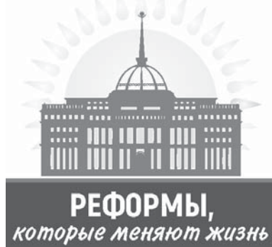
Коллаж Юрия Билушено

Более пяти тысяч семей в Караганде и Темиртау уже забыли, что такое топить печи углем и носить золу. Благодаря проекту по газификации региона они получают экологичное тепло в своих домах нажатием одной кнопки.