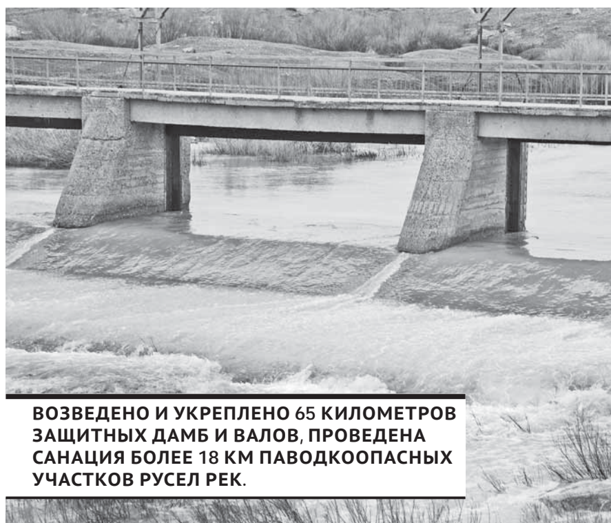
ВОЗВЕДЕНО И УКРЕПЛЕНО 65 КИЛОМЕТРОВ ЗАЩИТНЫХ ДАМБ И ВАЛОВ, ПРОВЕДЕНА САНАЦИЯ БОЛЕЕ 18 КМ ПАВОДКООПАСНЫХ УЧАСТКОВ РУСЕЛ РЕК.

В Казахстане запущена система Tasqyn, которая позволяет прогнозировать паводки.