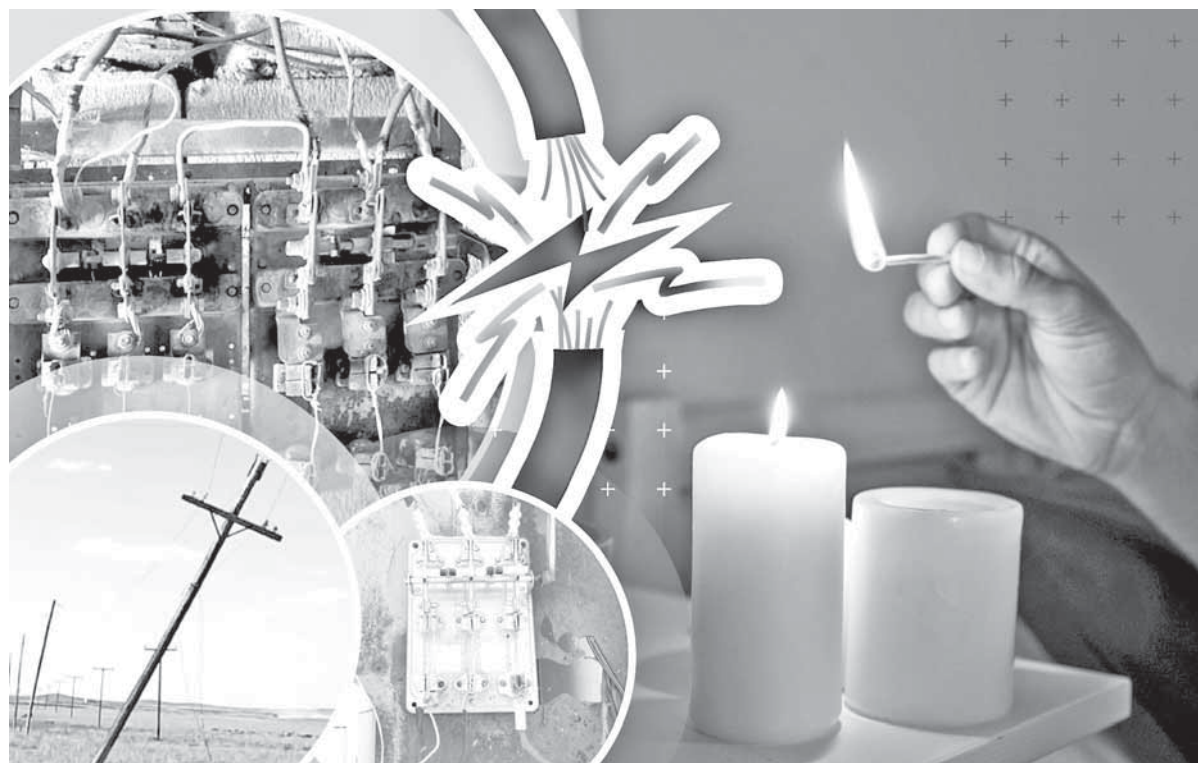
Коллаж Натальи Романовской

Чтобы восстановить подачу электроэнергии, акимат района объявил режим ЧС местного масштаба. Это поможет навести порядок в сфере энергоснабжения и обеспечить население