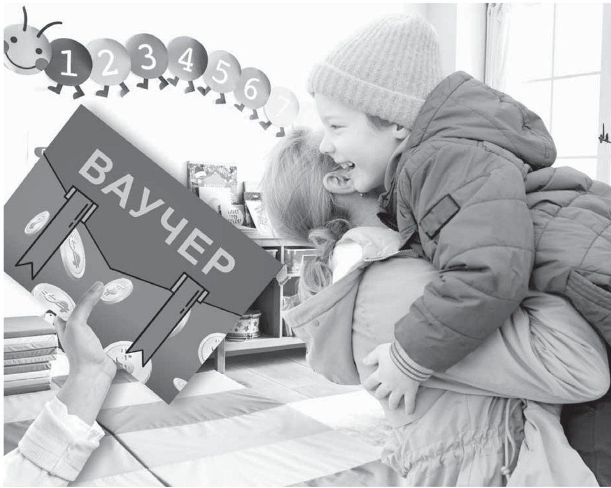
Коллаж Натальи Романовской, фото freepik.com

В прошлом году в пилотном режиме новый проект был запущен в трех городах Казахстана – Таразе, Шымкенте и Туркестане,