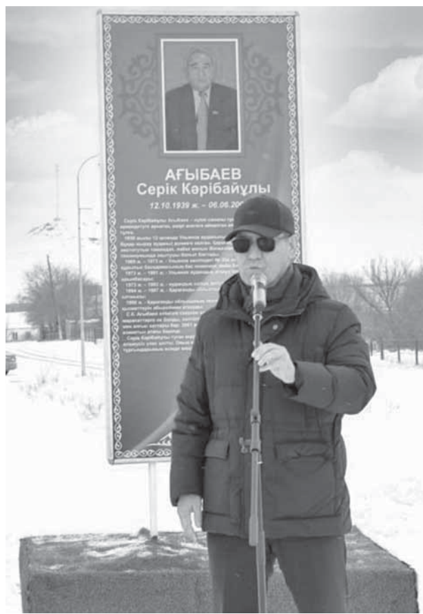
Бухар-Жырауский район