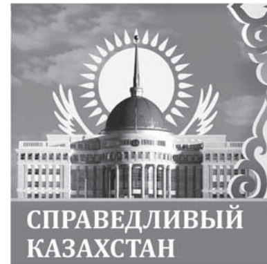
г. Астана