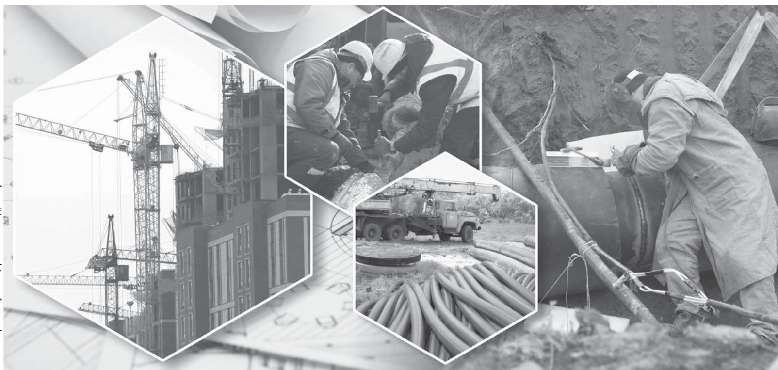
Коллаж Юрия Бугушанко, фото Александра Марченко

– Планируем провести реконструкцию тепломагистралей «Соединительная» и первой очереди: от ТЭЦ-3 до ЦТРИ-1, – пояснил Мейрам Кожухов. – Также в этом году будут увеличены расходы на теку-