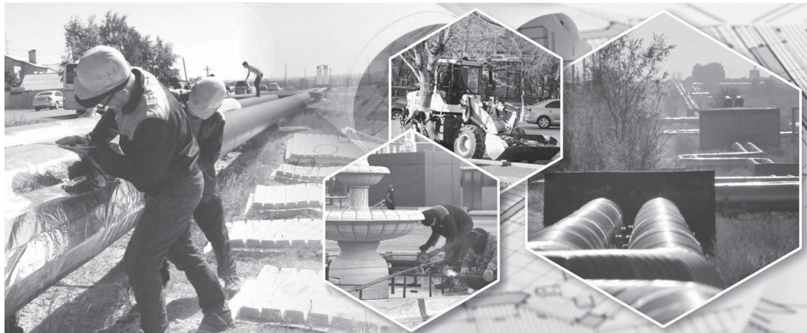
Коллаж Юрия Вилушенко, фото Александра Марченко

– Продолжатся реконструкция автодороги по улице Космонавтов, строительство дороги по улице Букетова: от улицы Муканова до автодороги на поселок Уштобе, – пояснил градоначальник Мейрам Кожухов. – Также появятся новые автодороги по улицам Муканова, Приканальной и