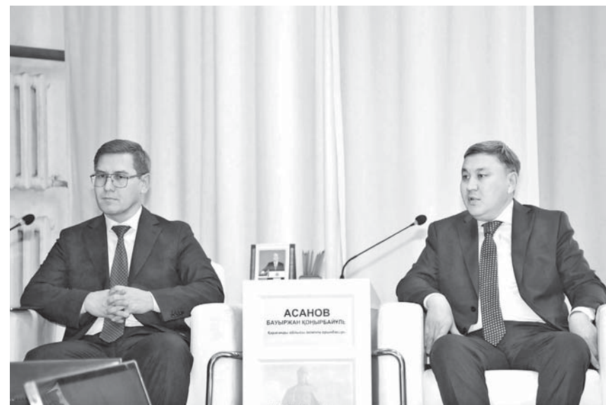
Фото акима Бухар-Жырауского района

В Бухар-Жырауском районе состоялся форум, посвященный вопросам развития сельских территорий и поддержки аграрного сектора. Собравшиеся обсудили реализацию на практике Послания Главы государства, в частности важность увеличения доли переработанной продукции в агропромышленном комплексе до 70% в течение трех лет.