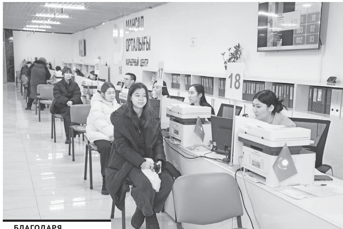
БЛАГОДАРЯ ЦЕНТРУ ТРУДОВОЙ МОБИЛЬНОСТИ НА ПОСТОЯННУЮ РАБОТУ УДАЛОСЬ УСТРОИТЬ 22 ТЫСЯЧИ ЧЕЛОВЕК, ИЗ НИХ 15 ТЫСЯЧ – МОЛОДЕЖЬ.

Здесь же расположилось управление по делам молодежи политики. На сегодняшний день четверть населения области составляют люди от 18 до 35 лет. Активную работу ведут 14 областных и региональных моло-