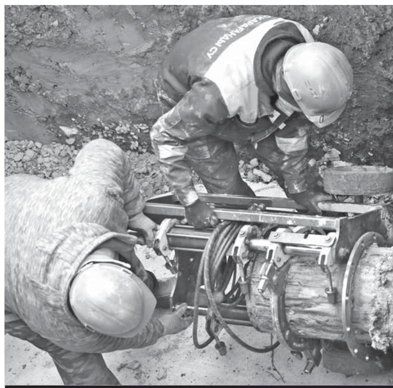
СУММА ЗАТРАТ НА КАПИТАЛЬНЫЙ РЕМОНТ ЭТИХ ЖИЗНЕННО ВАЖНЫХ ОБЪЕКТОВ СОСТАВЛЯЕТ 11 МЛРД ТЕНГЕ.

Еще одна болезненная тема коммунального хозяйства, которая касается уже всей области, – это критическое состояние канализационно-очистных сооружений. Всего их в регионе семь.