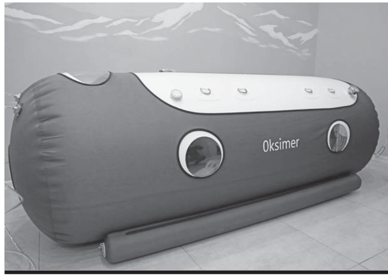
КИСЛОРОДНЫЙ КАБИНЕТ В РАМКАХ ПРОЕКТА «ДЕТСКИЙ ОЗДОРОВИТЕЛЬНЫЙ КОРРЕКЦИОННЫЙ КИСЛОРОДНЫЙ ЦЕНТР «ВАЛА OKSIMER» ОСНАЩЕН УНИКАЛЬНЫМ ДЛЯ РЕГИОНА ОБОРУДОВАНИЕМ.

Сегодня в области 13 предприятиям присвоен статус субъектов социального предпринимательства. Из них 11 находятся в Караганде и по одному – в Балхаше и поселке Уштобе Бухар-Жырауского района. Кто-то из них работает в сфере образования, здравоохранения, производства одежды и т.д. Им всем в этом году была оказана государственная поддержка в виде грантового финансирования до 5 млн тенге на развитие социальных проектов