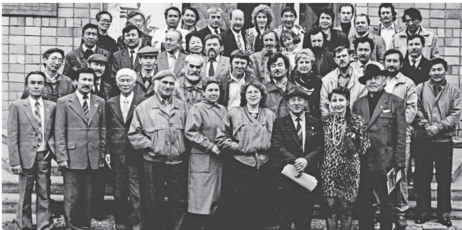
Мы все вместе. 90-е годы.