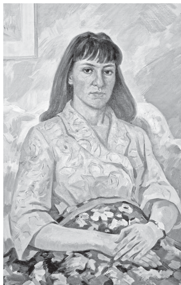
П.С. Андриюк. «Портрет дочери». 1970-е гг.

После проведения мемориальной выставки заслуженного деятеля искусств Казахской ССР Мингиша