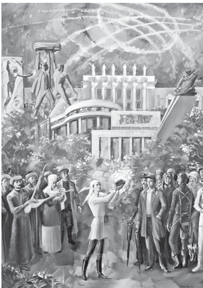
А.К. Бегалин. «Ода Караганде». 2024 г.

Материалы страницы подготовил Кайрат БЛЯЛОВ