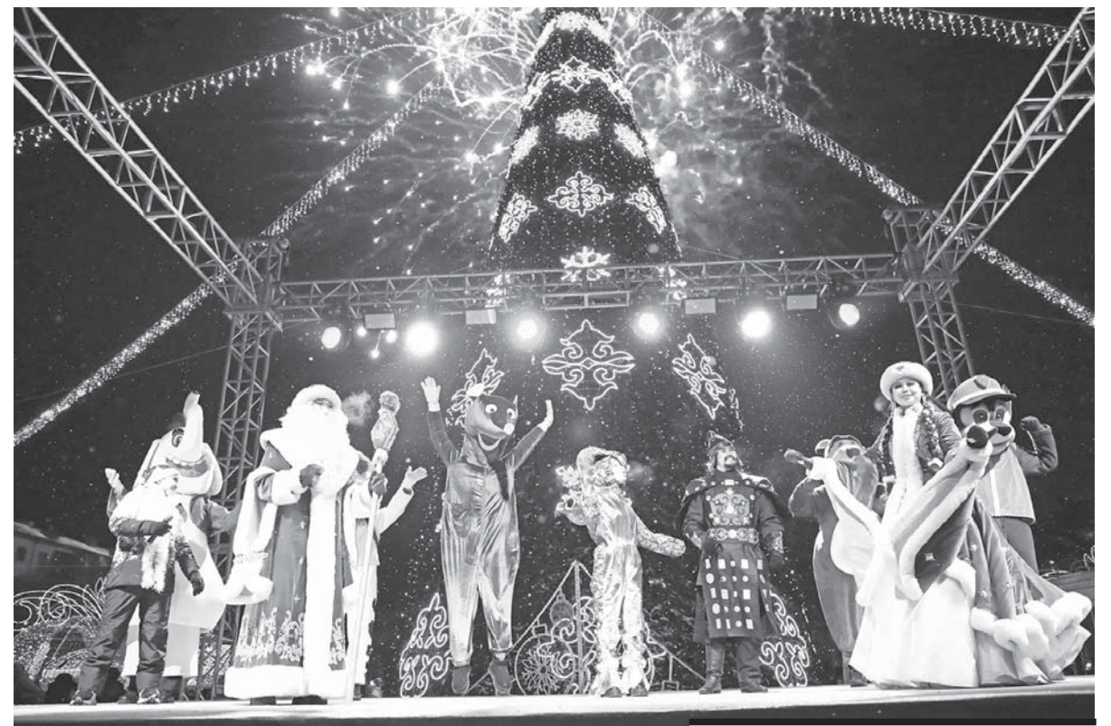
В ПАРКАХ И СКВЕРАХ ГОСТЕЙ И ЖИТЕЛЕЙ КАРАГАНДЫ ЖДУТ КРАСОЧНЫЕ ФОТОЗОНЫ И НОВЫЕ КАТКИ.