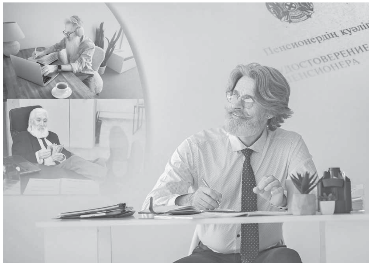
Коллаж Юрия Вилушеново фото freepik.com

По данным управления координации занятости и социальных программ, в Карагандинской области проживают 180 474 человека, получающих пенсионные выплаты. Средний размер пенсии в этом году составляет 86 162 тенге. По итогам анкетирования, в котором приняли участие жители региона до 70-75 лет, 42% намерены продолжить трудовую деятельность. Одни хотят получать дополнительный доход, у других есть потребность в передаче накопленных знаний, третьи стараются таким образом избежать одиночества. Также был проведен опрос и среди работодателей области, который выявил: только в 120 подведомственных организациях управлений есть потребность в 577 работниках пенсионного возраста, в том числе требующая определенной квалификации. Для них имеется 318 ва-