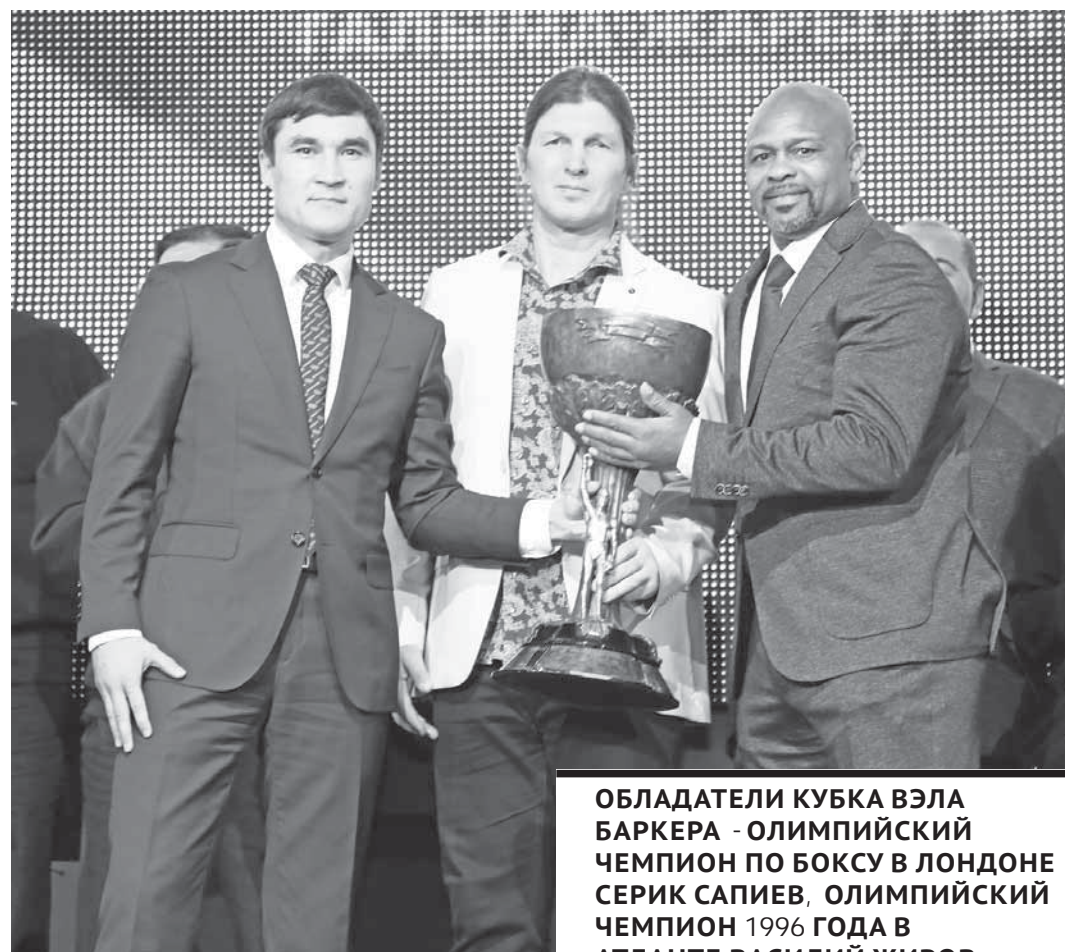
ОБЛАДАТЕЛИ КУБКА ВЭЛА БАРКЕРА – ОЛИМПИЙСКИЙ ЧЕМПИОН ПО БОКСУ В ЛОНДОНЕ СЕРИК САПИЕВ, ОЛИМПИЙСКИЙ ЧЕМПИОН 1996 ГОДА В АТЛАНТЕ ВАСИЛИЙ ЖИРОВ, АМЕРИКАНСКИЙ БОКСЕР, АБСОЛЮТНЫЙ ЧЕМПИОН МИРА СРЕДИ ПРОФЕССИОНАЛОВ РОЙ ДЖОНС-МЛАДШИЙ.