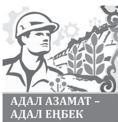
АДАЛ АЗАМАТ – АДАЛ ЕҢБЕК