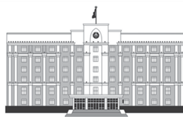
АКИМАТ КАРАГАНДИНСКОЙ ОБЛАСТИ

Сейчас на теплоцентрали в работе – пять котлоагрегатов, три турбогенератора, в резерве два водогрейных пиковых котла. Капитальный ремонт еще одного котла и турбины близится к завершению.