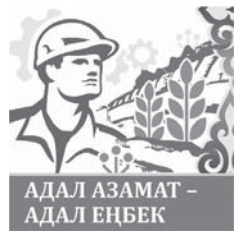
АДАЛ АЗАМАТ – АДАЛ ЕНБЕК