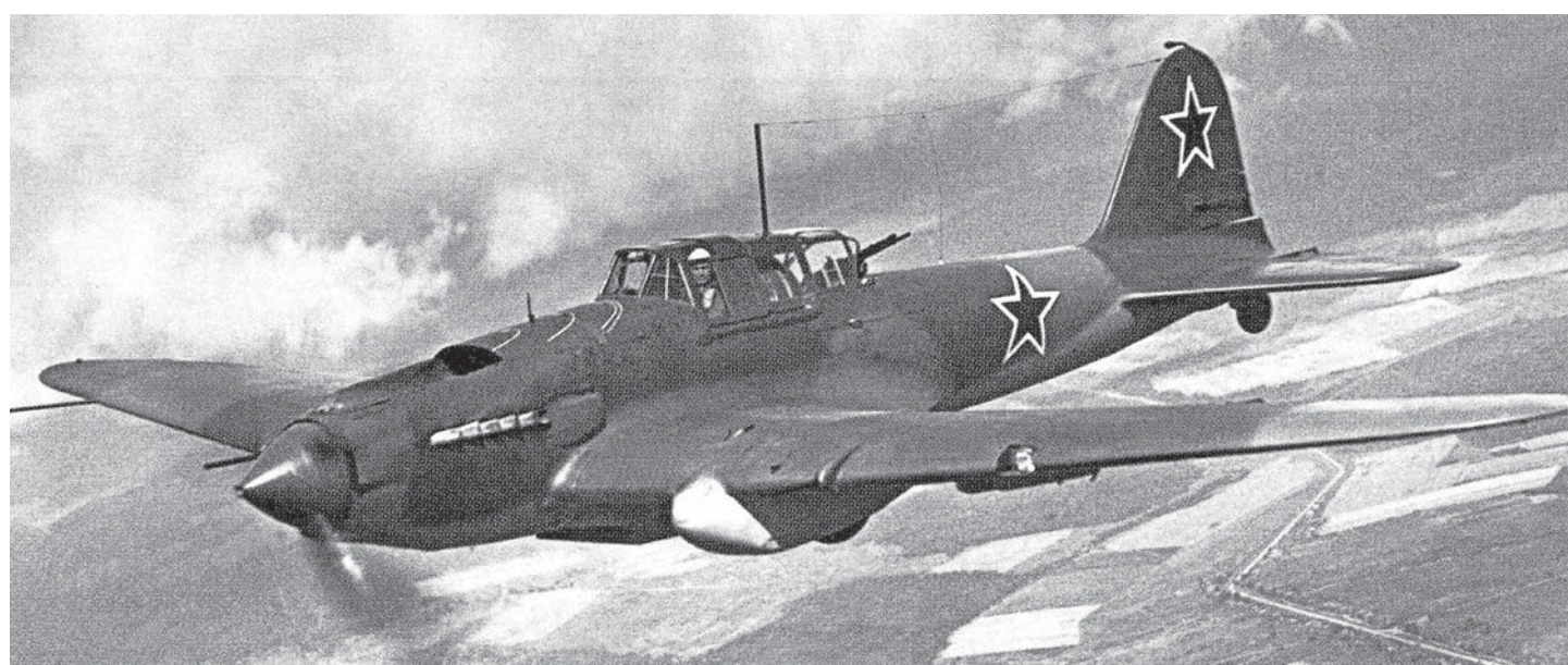
Ил-2 в атаке.