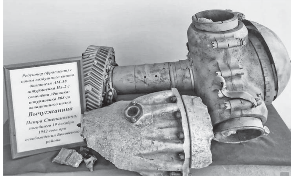
Обломки Ил-2 в музее.