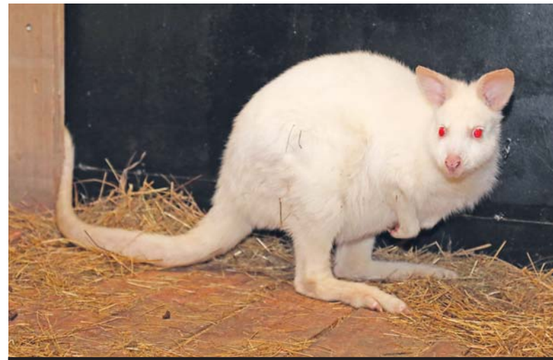
БЕЛЫЕ КЕНГУРУ ТЯЖЕЛО ПЕРЕНЕСЛИ ПЕРЕЛЕТ, БОЛЕЛИ И ХАНДРИЛИ, НО СЕЙЧАС АККЛИМАТИЗИРОВАЛИСЬ И ПРИШЛИ В СЕБЯ.

– Сегодня у нас есть возможность создавать действительно хорошие условия для наших подопечных. Чтобы им было просторно, питание полноценное, необходимое лечение. До конца года новых животных в зоопарке пока не будет. Сейчас ведем переговоры с другими зоопарками на 2025 год по десяти новым позициям. Уже договорились насчет канадских бизонов – двух самок и одного самца. Всегда стараемся, чтобы была такая семья. Это своеобразная стратегия, которая