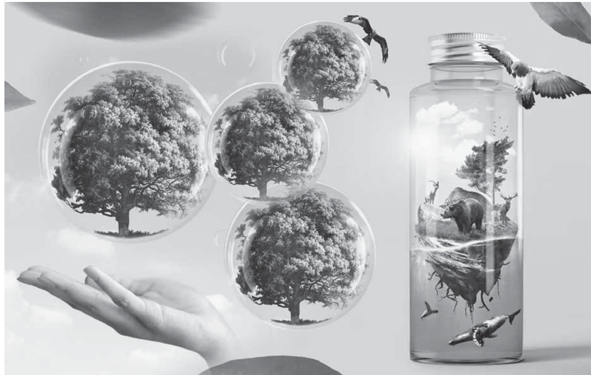
Коллаж Юрия Вилушенко

– Каждую минуту человечество производит шесть тысяч тонн мусора. И собранные 30-50 мешков отходов являются лишь крупницей, – добавил Дамир Каримов. – Задумайтесь, все экологические катастрофы создают люди с низким уровнем экологической культуры, которые не знают, как выстроить отношения с окружающей средой, чтобы никто не страдал при этом. Самое