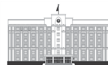
АКИМАТ КАРАГАНДИНСКОЙ ОБЛАСТИ

Кроме того, глава министерства считает, что с учетом географического положения и инфраструктуры Карагандинская область может стать не только казахстанским опорным торгово-логистическим центром, но и центральноазиатским хабом.