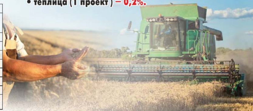
Коллаж Юрия Вилушено

сельскохозяйственным кооперативам на сумму 655 млн, при этом будет создано 158 рабочих мест, – отметил глава региона.