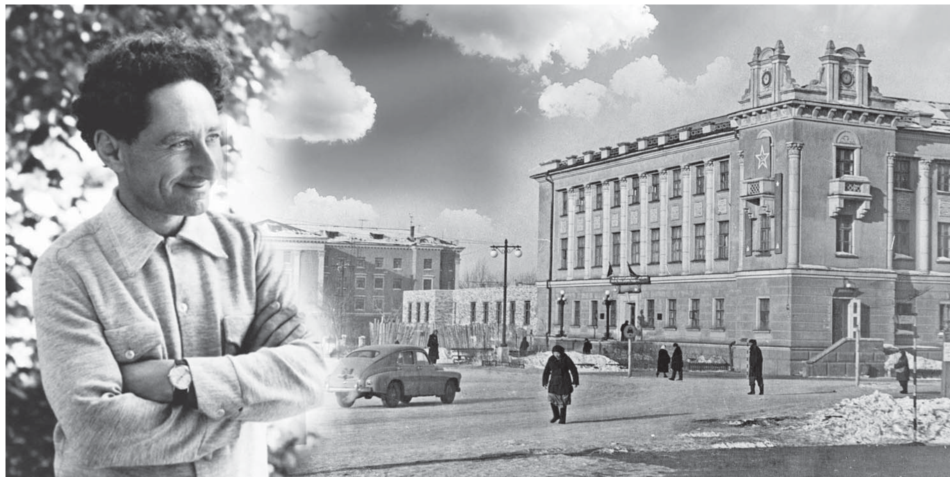
Коллаж Юрия Вилушенко