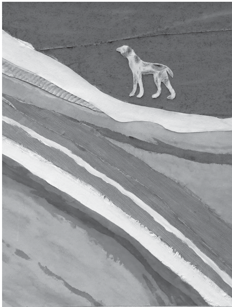
С. Лотарева. «Собака на берегу». Ткань, аппликация. 2024.