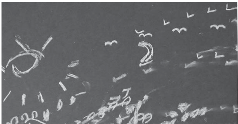
Н. Калиева. «Летучий голландец». Бумага, акварель. 2024.