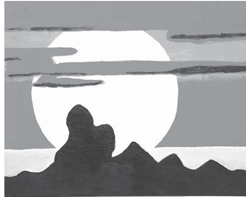
Н. Рахимова. «Рассвет». Холст, акрил. 2024.

Каждого участника отличают свой почерк, мироощущение. В работы незрячие художники