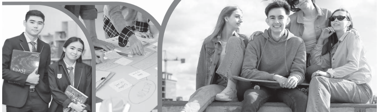
Коллаж Юрия Вулушечко

носили не временный, а постоянный характер – для этого помощь акимату должно оказывать управление по вопросам молодежной политики.