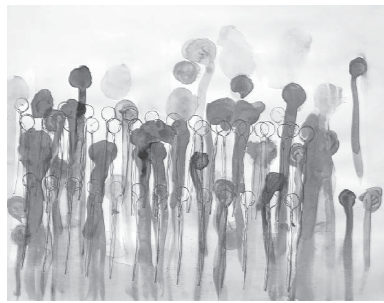
О. Майпасов. «Люди». Бумага, акварель. 2024.