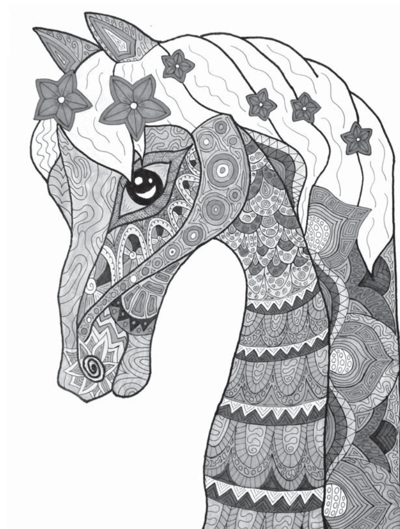
А. Садвакасова. «Лошадка». Бумага, ручка гелевая. 2024.