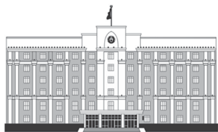
АКИМАТ КАРАГАНДИНСКОЙ ОБЛАСТИ

Глава региона Ермаганбет Булекпаев отметил, что профилактика наркомании в