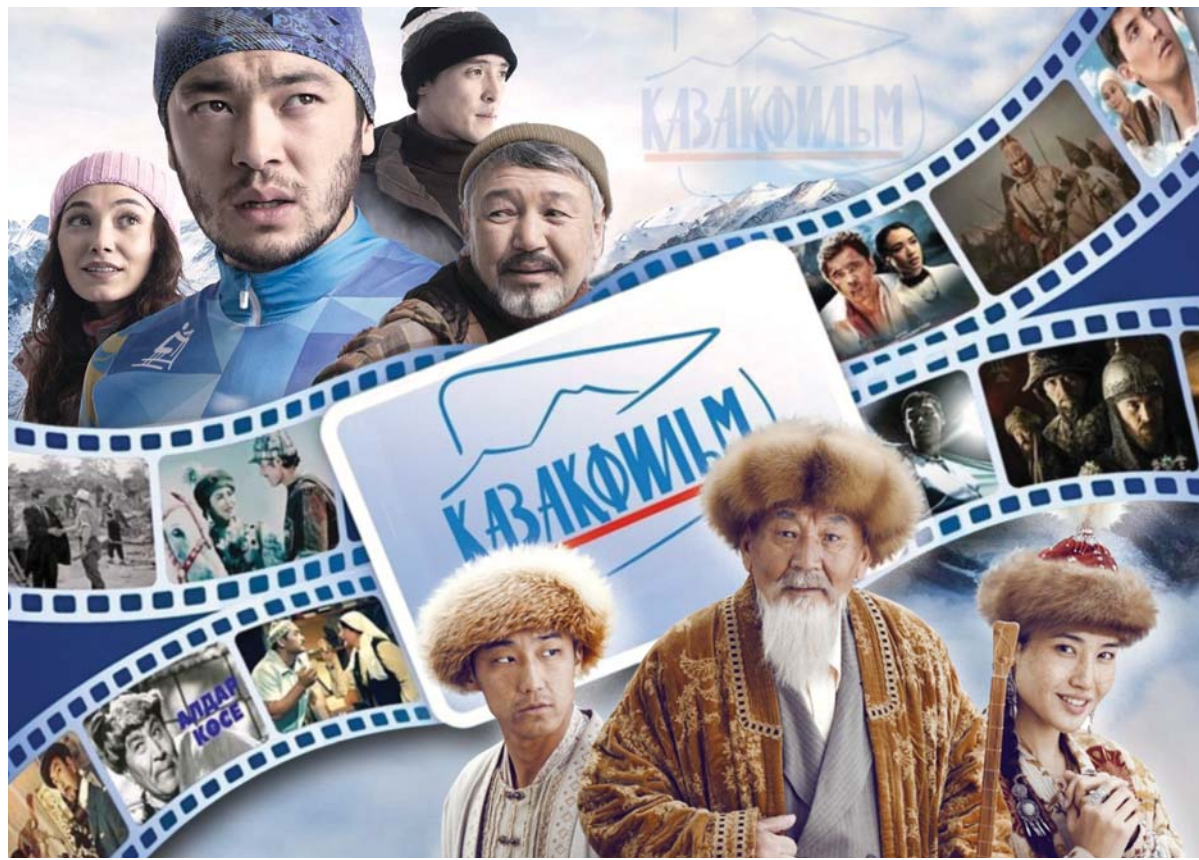
Коллаж Натальи Романовской

Караганда как культурный центр всегда шла на шаг впереди и отличалась своими новшествами. Тому пример – Дни казахстанского кино, которые проводят здесь не первый год. Демонстрируют киноискусство не только национальной студии «Казахфильм», но и другие отечественные фильмы.