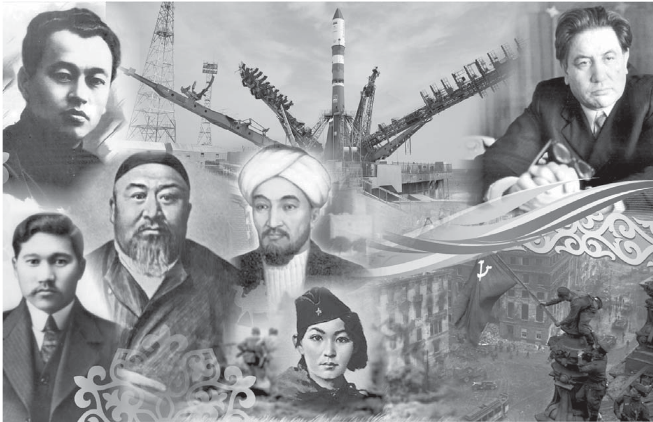
Коллаж Наталья РОМАНОВСКОЙ

Карагандинская универсальная научная библиотека им. Н.В. Гоголя издала календарь знаменательных и памятных дат Республики Казахстан на 2025 год. Там можно найти как государственные праздники, так и юбилеи известных личностей. Его отличие от классического заключается в том, что к нему прилагается список изданий нашего книгохранилища, где можно узнать всю информацию о человеке и событии.