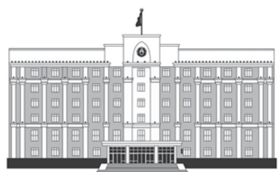
АКИМАТ КАРАГАНДИНСКОЙ ОБЛАСТИ