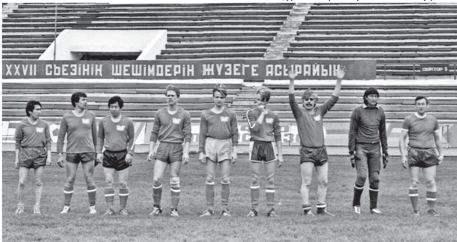
Капитан футбольной команды «Индустриальной Караганды» и Карагандинского телевидения перед очередным матчем.

Дальше он снова возвращался в «Известия». А главным делом его жизни стало создание Национального пресс-клуба, который с 90-х годов стал авторитетной информационной площадкой, где выступали не только представители власти, но и оппози-