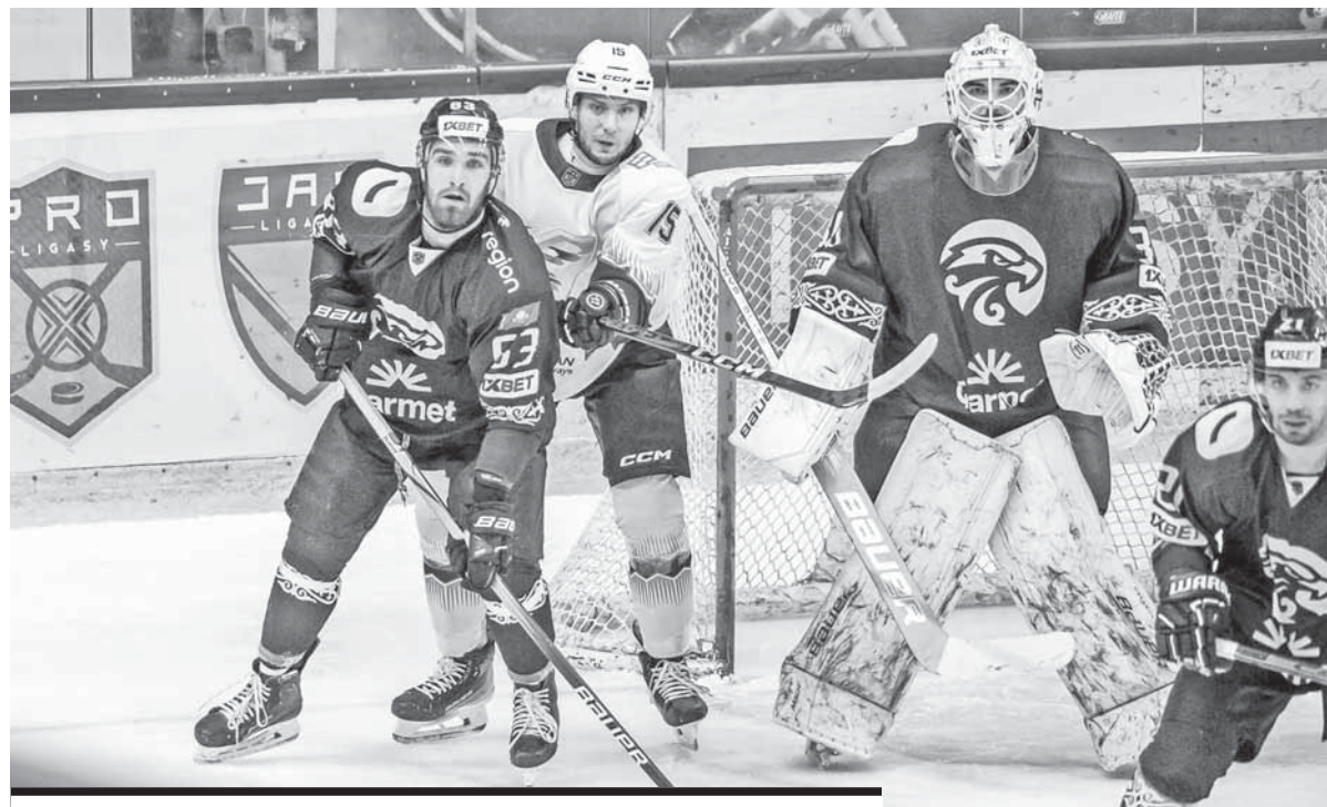
16 и 17 ОКТЯБРЯ «САРЫАРКА» ПРОВЕДЕТ ВЫЕЗДНЫЕ МАТЧИ С КОМАНДОЙ «АЛМАТЫ».

Уверенно начали вторую двадцатиминутку гости из Узбекистана. После перерыва карагандинцы немного расслабились и в основном оборонялись. Ташкентцы стреляли из любой позиции, в одной из атак им удалось сравнять счет в матче. Жакен отбил первый удар нападающего «Хумо», со второй попытки другой игрок