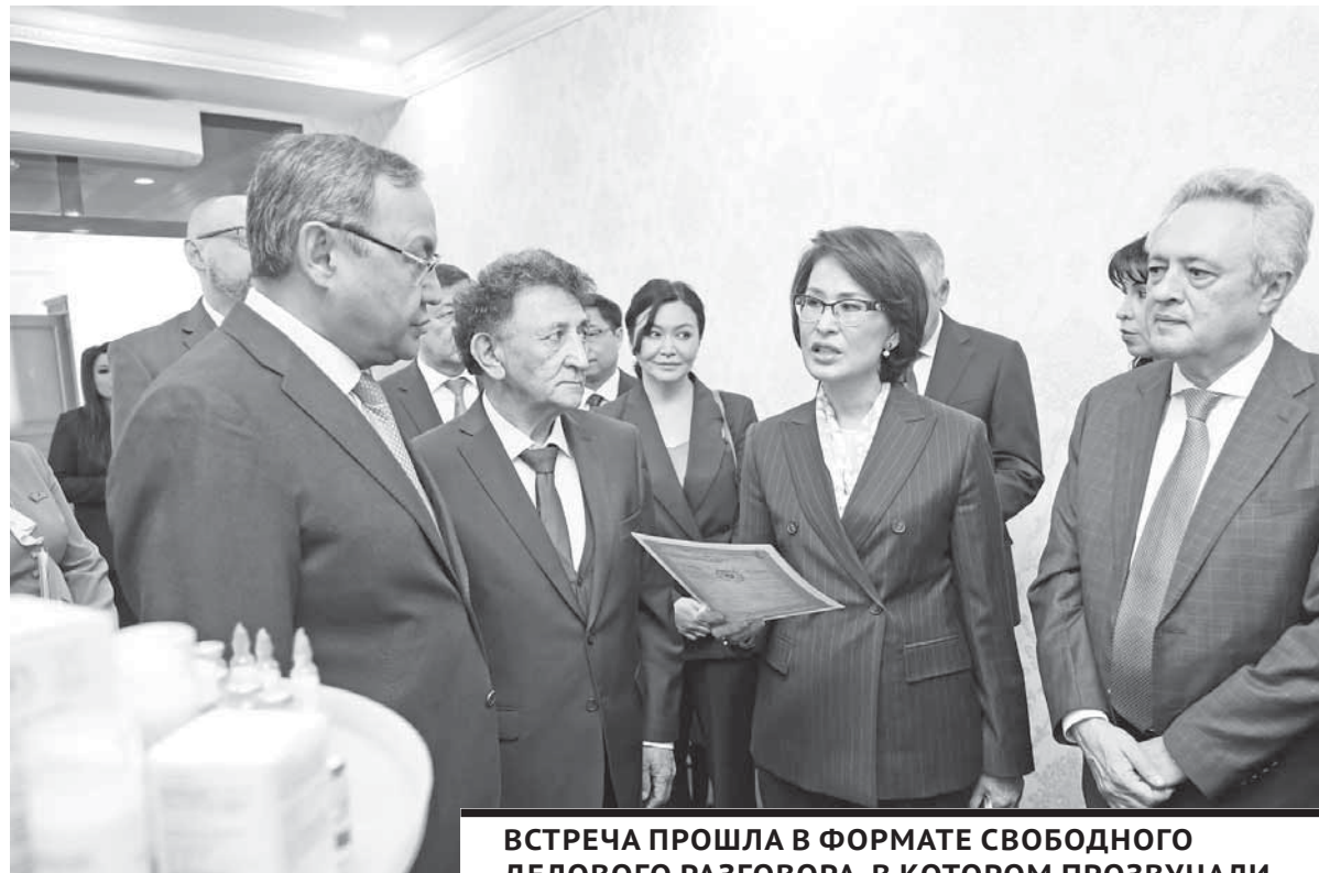
ВСТРЕЧА ПРОШЛА В ФОРМАТЕ СВОБОДНОГО ДЕЛОВОГО РАЗГОВОРА, В КОТОРОМ ПРОЗВУЧАЛИ НОВЫЕ ИДЕИ, ПРЕДЛОЖЕНИЯ И ПОДХОДЫ К РЕШЕНИЮ СУЩЕСТВУЮЩИХ ПРОБЛЕМ В НАУЧНОЙ МЕДИЦИНЕ.

– Караганда – центр фармацевтического производства. Научно-производственный центр «Фитохимия», Карагандинский фармацевтический комплекс и