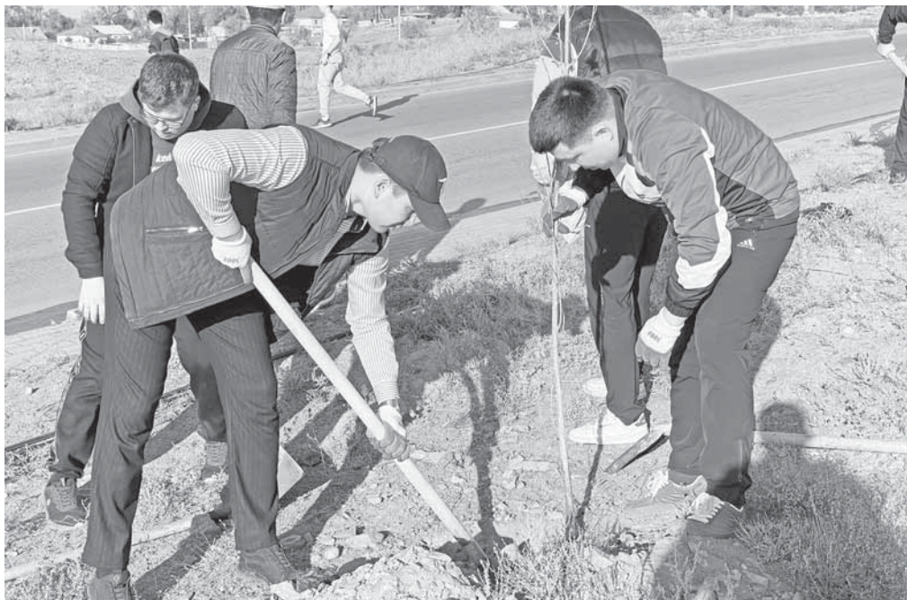
Коллаж Юрия Билушено

В рамках республиканской экологической программы «Таза Қазақстан» в Приозерске состоялась значимая акция по посадке деревьев под названием «Ағаш отырғызу». Ее цель – улучшение экологии города, привлечение внимания к проблемам охраны окружающей среды и повышение осведомленности населения о важности озеленения.