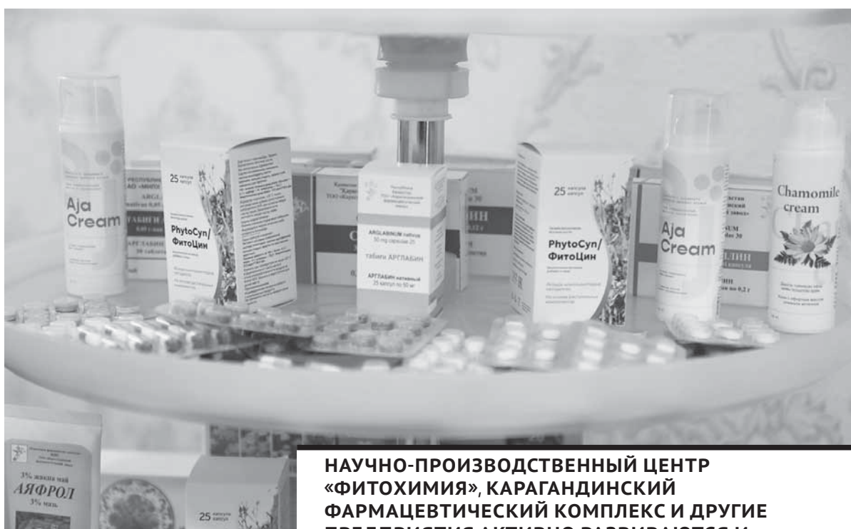
НАУЧНО-ПРОИЗВОДСТВЕННЫЙ ЦЕНТР «ФИТОХИМИЯ», КАРАГАНДИНСКИЙ ФАРМАЦЕВТИЧЕСКИЙ КОМПЛЕКС И ДРУГИЕ ПРЕДПРИЯТИЯ АКТИВНО РАЗВИВАЮТСЯ И ПОМОГАЮТ УКРЕПЛЯТЬ ПОЗИЦИИ КАЗАХСТАНА В ОБЛАСТИ ПРОИЗВОДСТВА ЛЕКАРСТВЕННЫХ ПРЕПАРАТОВ.