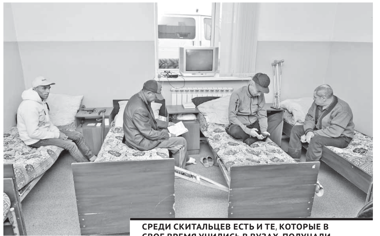
СРЕДИ СКИТАЛЬЦЕВ ЕСТЬ И ТЕ, КОТОРЫЕ В СВОЕ ВРЕМЯ УЧИЛИСЬ В ВУЗАХ, ПОЛУЧАЛИ КВАЛИФИКАЦИЮ. У НЕКОТОРЫХ НЕЗАКОНЧЕННОЕ ВЫСШЕЕ ОБРАЗОВАНИЕ.

– Поход в магазин осуществляется в сопровождении нашего сотрудника. Также установлены камеры видеонаблюдения, с их помощью мы следим за порядком. Например, в домах престарелых и инвалидов постояльцам разрешается выходить в дневное