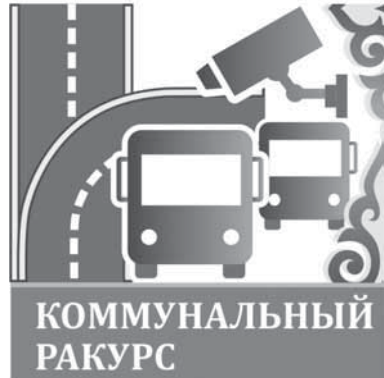
Коллаж Юрия Вилушенко, фото Александра Марченко

Сегодня во всех городах и районах Карагандинской области, за исключением Балхаша и Приозерска, официально начинается отопительный сезон. Подготовка завершена, батареи будут поэтапно нагреваться в домах жителей региона в ближайшие дни.