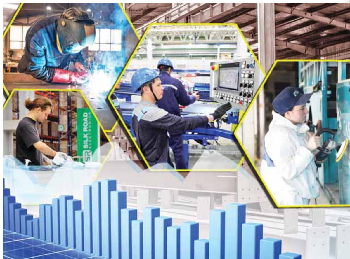
Комплекс Юрий Выпущенко

К примеру, из стен учебного заведения выходят автослесари, слесари механосборочных работ, слесари-ремонтники, сварщики. Ребята трудятся на таких предприятиях, как ТОО «QazTehna», которое занимается выпуском автобусов и спецтехники. К слову, для этого завода колледж по це-