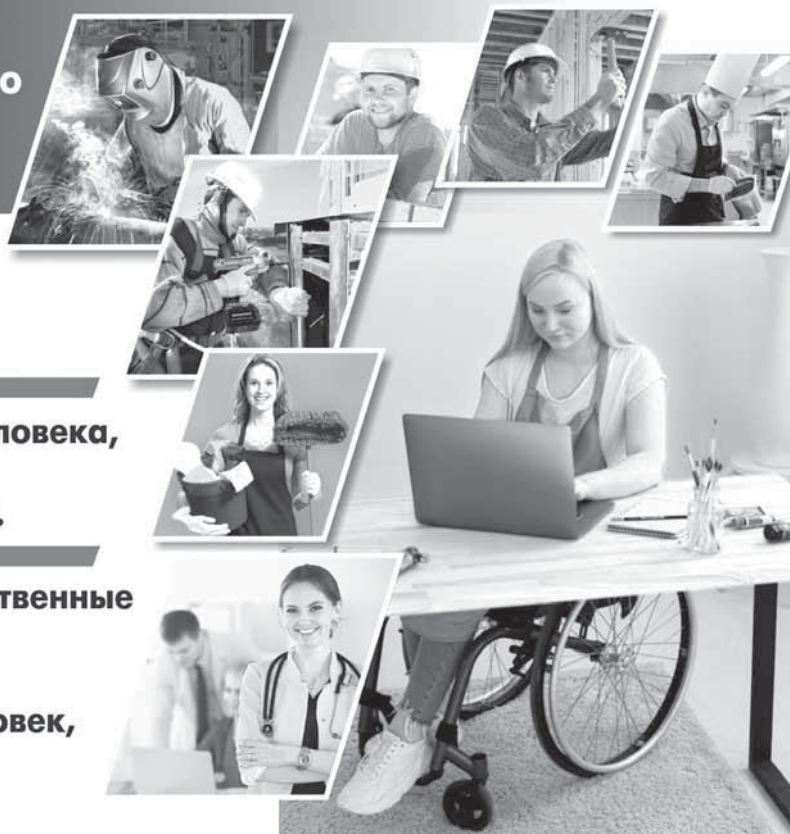
Коллаж: Юлия Вилушенко

При поддержке госорганов работодателями создано 11 специальных рабочих мест для людей с нарушением слуха. Они успешно