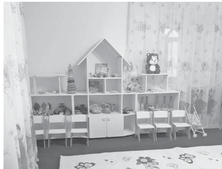
Каркаралинский район

водой из местной речки Каркаралинки. Прилегающую территорию облагородили: уложили брусчатку, установили опоры освещения, беседки, качели. Имеется и спасательная вышка, где будут дежурить специалисты. Появились пешеходный мост и игровые элементы. Предусмотрены зоны для предпринимателей, а также парковки для автомобилей. Зимой на плотине планируют заливать каток. Строительство объекта начали в прошлом году, на эти цели выделено 525 миллионов тенге. Плотина наряду с другими проектами также придаст импульс развитию предпринимательства и туризма в районе.