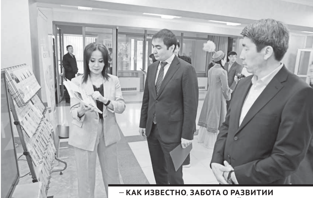
– КАК ИЗВЕСТНО, ЗАБОТА О РАЗВИТИИ ЯЗЫКОВ ВОЗВЕДЕНА В НАШЕЙ СТРАНЕ В РАНГ ГОСУДАРСТВЕННОЙ ПОЛИТИКИ.

СПЕЦИАЛИСТЫ ПОДРОБНО РАССКАЗАЛИ ГОСТЯМ О НОВЫХ ОБУЧАЮЩИХ ПОСОБИЯХ КАК НА БУМАЖНЫХ, ТАК И ЭЛЕКТРОННЫХ НОСИТЕЛЯХ.