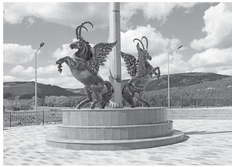
г. Каркаралинск

Как отметили в администрации района, празднование юбилея Каркаралинска проходит с начала года. Были проведены различные культурно-массовые и спортивные мероприятия. Реализуются масштабные проекты по благоустройству. Преобразилась территория близ водоемов Каратөбе и Плотина. После капитального ремонта состоялось торжественное открытие Дворца культуры имени Ш. Жандарбековой. Ведутся работы по строительству стадиона, реконструкции монумента Ту-тұғыр, реставрации мечети Құнанбай жақы, ремонту центральной улицы Т. Аубакирова. В городе высажены 9 000 цветов и около 800 саженцев деревьев различных пород.