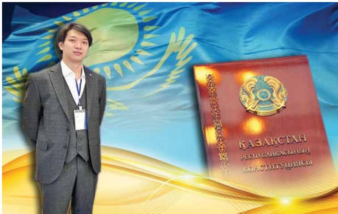
Коллаж Юрия Вилушено

– Взрослея, я стал больше осознавать важность этой даты. Никогда не чувствовал себя ущемленным или обделенным. Родился и вырос в Караганде. Наравне с другими ребятами разных национальностей и конфессий окончил школу, получил высшее образование. С малых лет занимался твор-