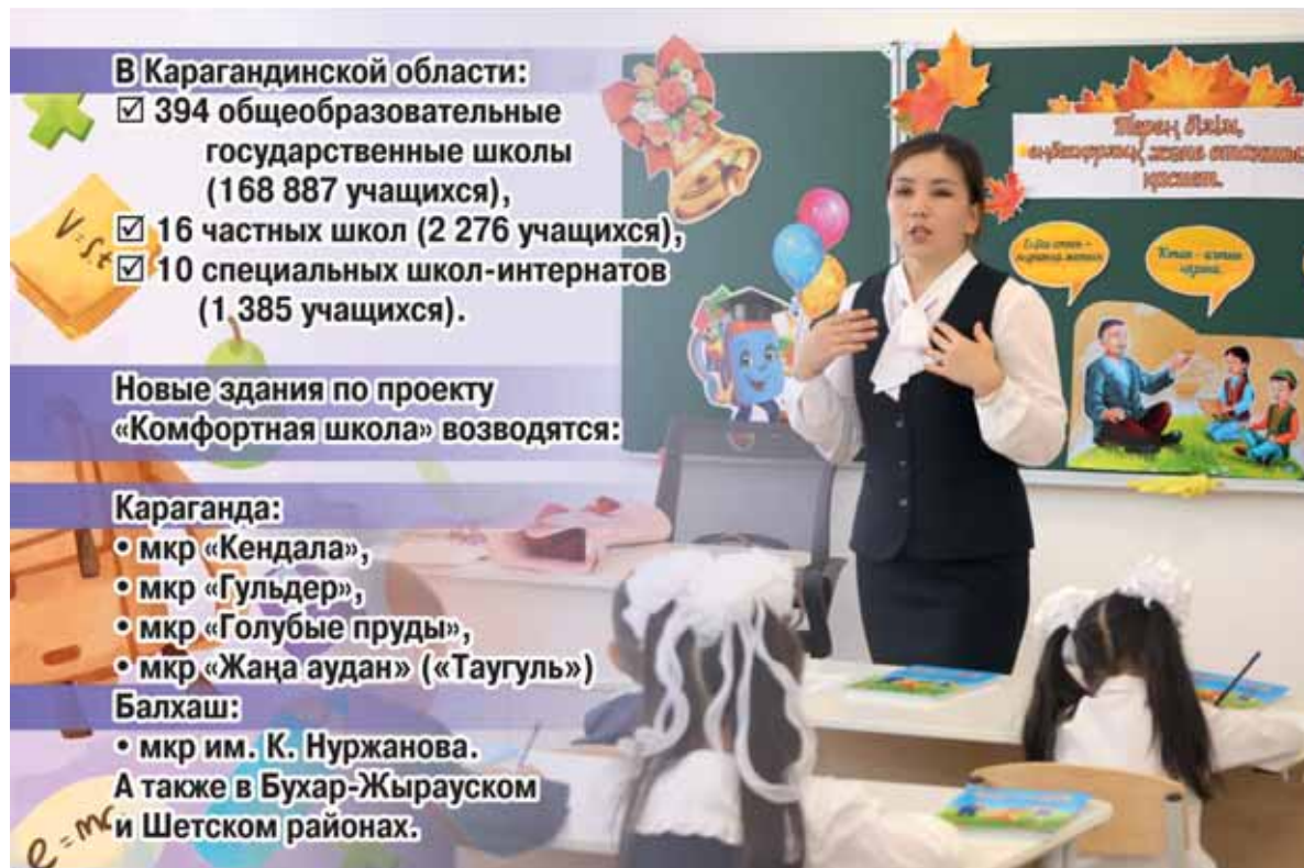
Коллаж Юрия Вилушено

В этом году в Карагандинской области за парты сядут почти 17 тысяч первоклассников.