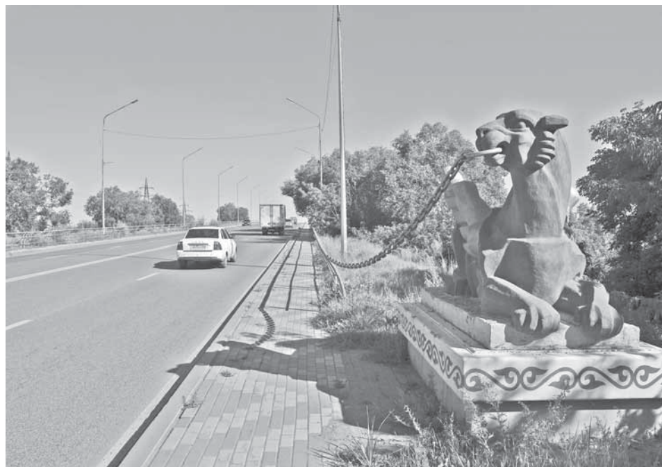
«Федоровский» на пересечении ул. Ермакова – ул. Липецкой.