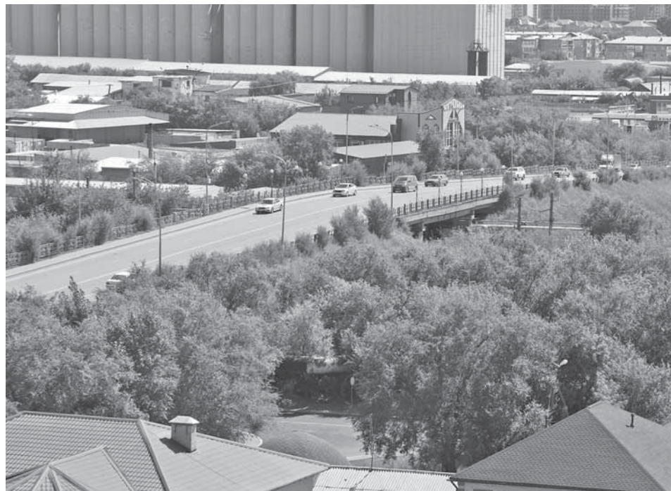
«Гоголевский» на пересечении ул. Гоголя и пр. Н. Абдилова.