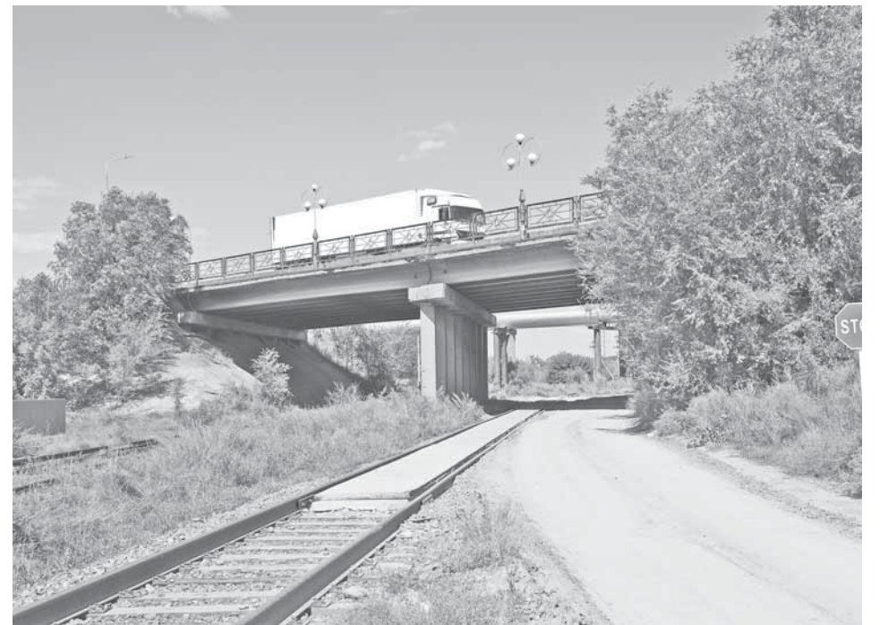
«Голубые пруды» на перекрестке трассы «Голубые пруды» – 7-я магистраль

И последний, седьмой – «мост гаданий». Желательно, чтобы он был над водой. На нем можно узнать, кто в новой семье будет главным. Для этого молодожену надо кинуть по розе и перейти на другую сторону моста, чтобы посмотреть, чей цветок выплывает первым.