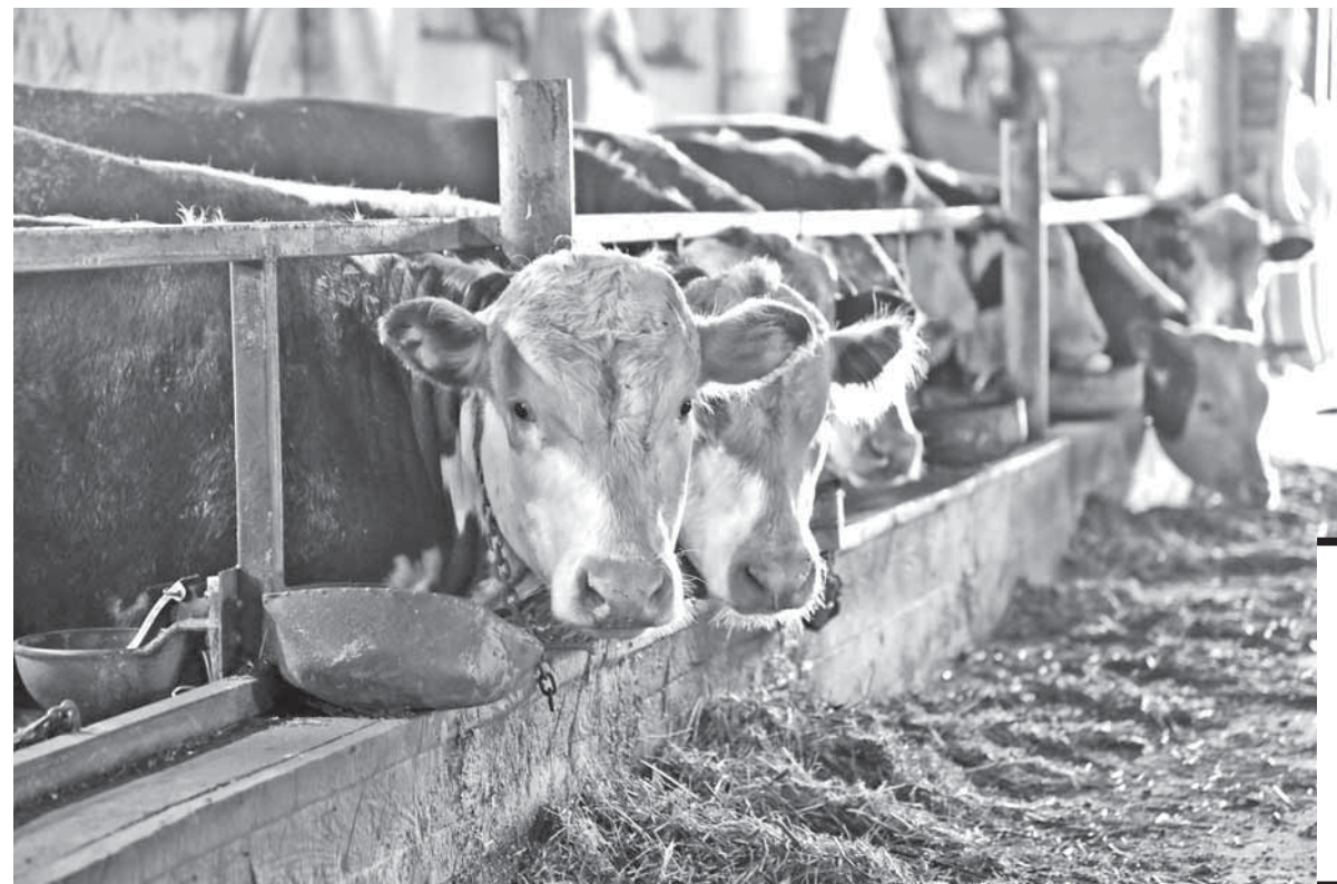
Бухар-Жырауский район

СКОТ ПОЛНОСТЬЮ ОБЕСПЕЧЕН КОРМАМИ СОБСТВЕННОГО ПРОИЗВОДСТВА – ЭТО ДРОБЛЕННЫЕ ЗЕРНО И ЯЧМЕНЬ, ОВЕС, СЕНО, СЕНАЖ, ДОЙНИК. ХРАНЯТСЯ КОРМА НА СПЕЦИАЛЬНЫХ СКЛАДАХ.