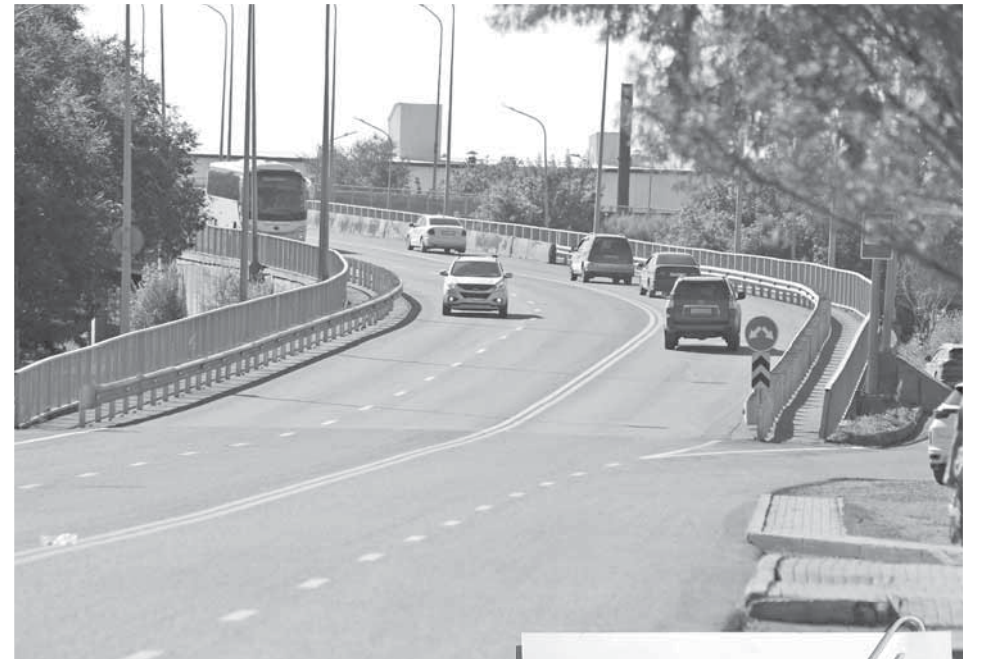
«ДСК» пр. С. Сейфуллина с выездом на трассу в пос. Актас.