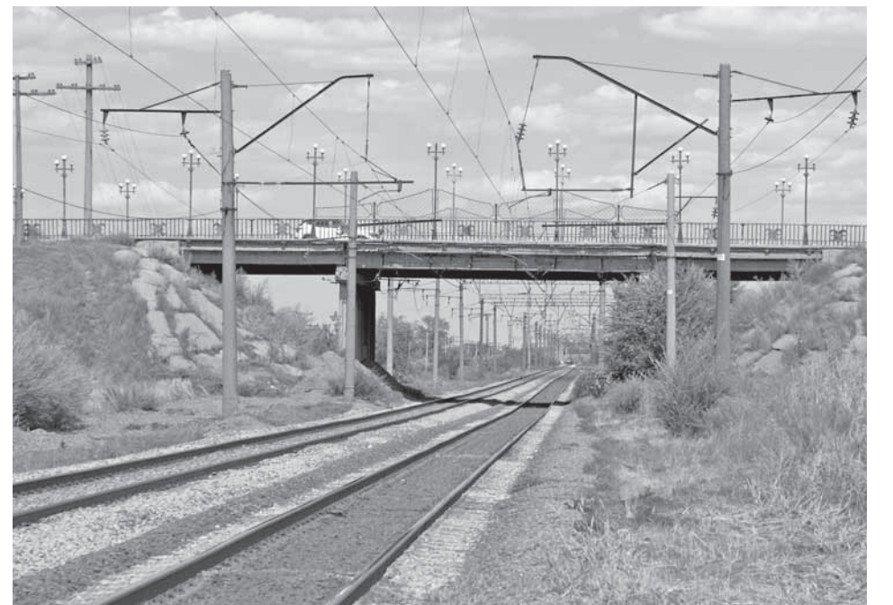
«Архитектурный» на одноименной улице.