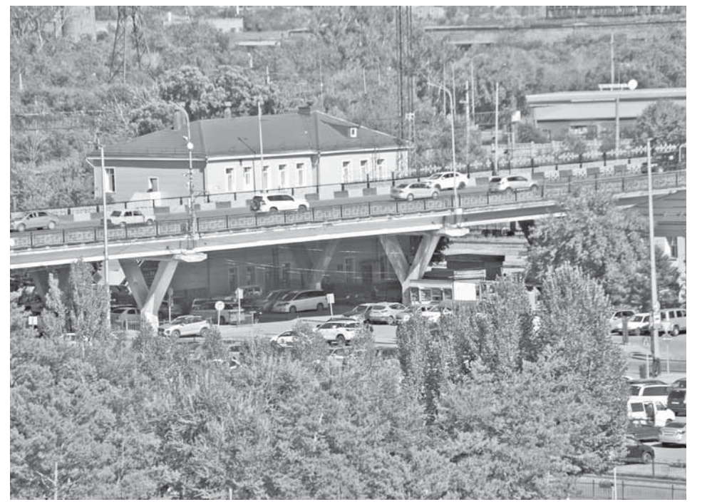
«Бухар-жырау» на пересечении ул. Ермакова – пр. Бухар-жырау