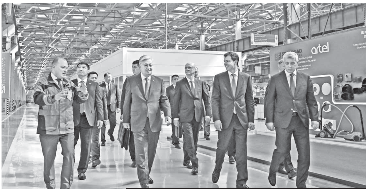
ПОСЛЕ ПОСЕЩЕНИЯ ОБЪЕКТОВ В ТЕМИРТАУ И КАРАГАНДЕ ПРЕЗИДЕНТСКИЙ КОРТЕЖ ОТПРАВИЛСЯ В ГОРОД САРАНЬ. ЗДЕСЬ ГЛАВА ГОСУДАРСТВА ПОСЕТИЛ ПРЕДПРИЯТИЕ SILK ROAD ELECTRONICS, СПЕЦИАЛИЗИРУЮЩЕЕСЯ НА ПРОИЗВОДСТВЕ БЫТОВОЙ ТЕХНИКИ И ЭЛЕКТРОНИКИ.

Касым-Жомарту Токаеву рассказали, что в 13 кружках и секциях занимаются 1600 детей. Для школьников открыты HI-TECH цех, творческая мастерская, зал хореографии, ART-студия, студии записи, телевидения и фото, VR-архитектуры и WEB-дизайна, Intellectum-студия, кабинет интернета вещей, лаборатория робототехники и технического творчества, STEM-лаборатория, музыкальная студия, экологический центр, спортивные и игровые площадки. Здание общей площадью 3,3 тыс. квадратных метров оснащено необходимым оборудованием для обеспечения и получения качественного дополнительного образования.