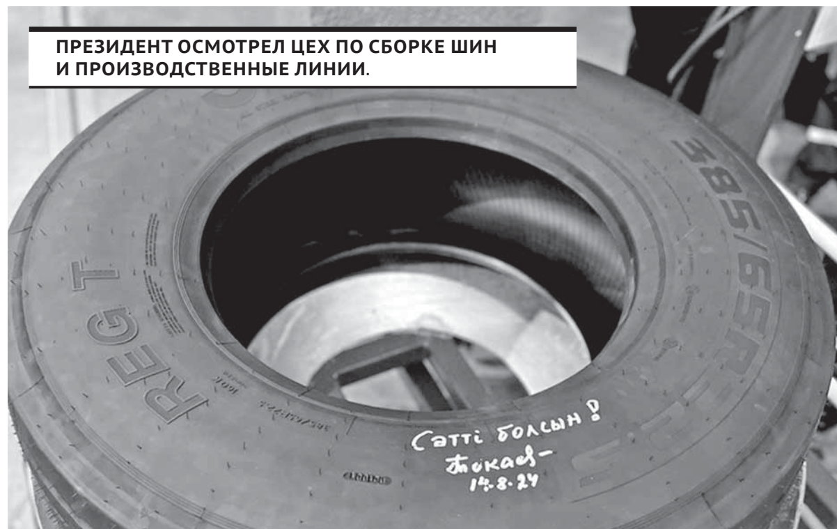
ПРЕЗИДЕНТ ОСМОТРЕЛ ЦЕХ ПО СБОРКЕ ШИН И ПРОИЗВОДСТВЕННЫЕ ЛИНИИ.

КАСЫМ-ЖОМАРТ ТОКАЕВ ПОДЧЕРКНУЛ, ЧТО ГОСУДАРСТВО ПРОДОЛЖИТ УДЕЛЯТЬ ОСОБОЕ ВНИМАНИЕ РАЗВИТИЮ СЕЛА И ОКАЗЫВАТЬ ПОДДЕРЖКУ ФЕРМЕРАМ.