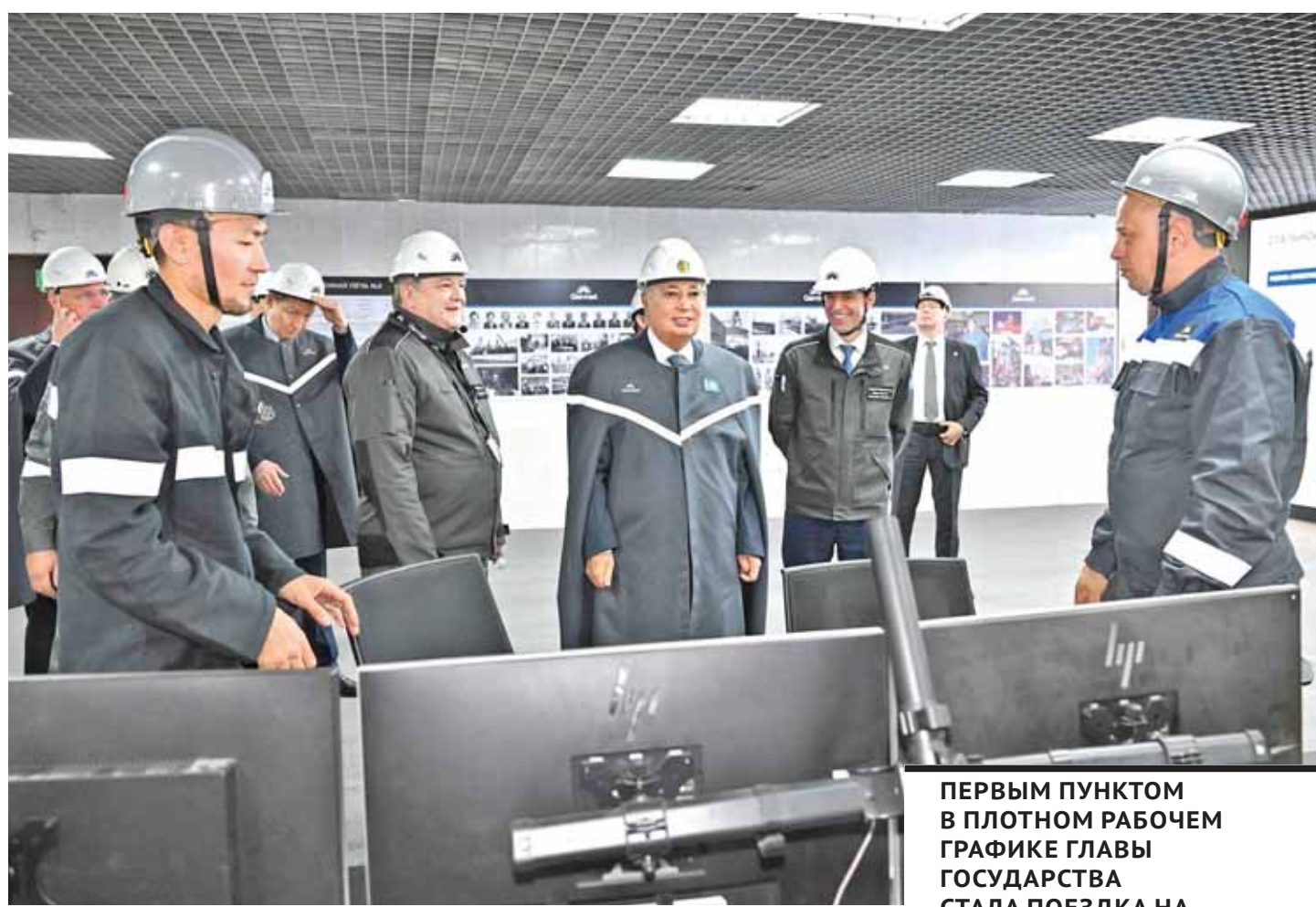
ПЕРВЫМ ПУНКТОМ В ПЛОТНОМ РАБОЧЕМ ГРАФИКЕ ГЛАВЫ ГОСУДАРСТВА СТАЛА ПОЕЗДКА НА МЕТАЛЛУРГИЧЕСКИЙ КОМБИНАТ QATMET.

– Мы приняли правильное решение, пригласили отечественного инвестора, который активно приступил к работе. Положение на комбинате значительно улучшается по сравнению с тем, что было раньше. Но останавливаться нельзя. Главная задача – это возродить былую славу Qatmet и уделить самое присталь-