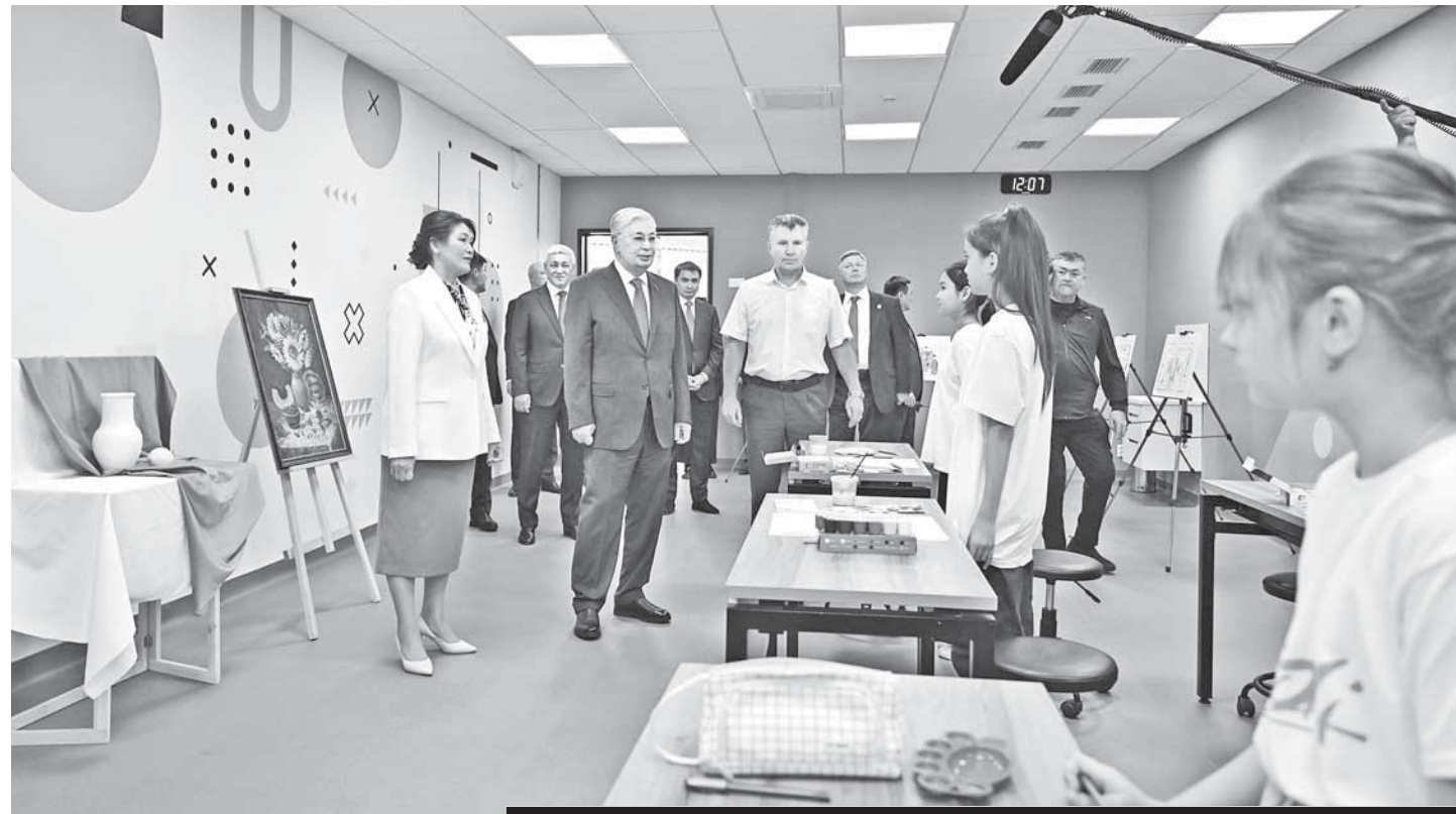
ГЛАВА ГОСУДАРСТВА ПОСЕТИЛ НЕДАВНО ОТКРЫВШИЙСЯ ДВОРЕЦ ШКОЛЬНИКОВ «КӘУСАР», КОТОРЫЙ НАХОДИТСЯ В ПРИШАХТИНСКЕ В КАРАГАНДЕ.