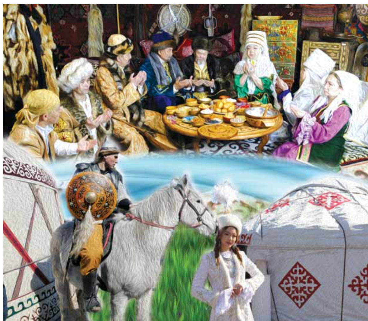
Коллаж Натальи Романовской

Как правило, оно представляет собой письменное или устное перечисление предков по прямой мужской линии. Большинство могут восстановить от 7 до 25 колен предков непосредственно в своем роду. Поговорка «Жеті атасын білмеген жетесіз» призывает к ответственности знать свою родословную для